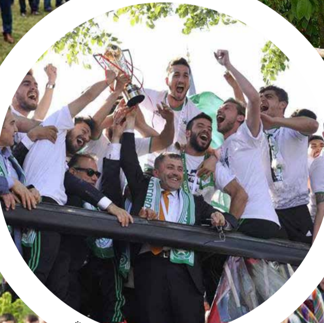
Üsküdar Belediye Başkanı Hilmi Türkmen