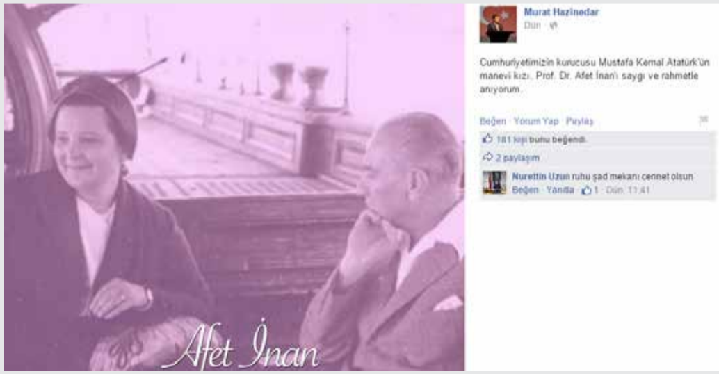
Beşiktaş Belediye Başkanı Murat Hazinedar