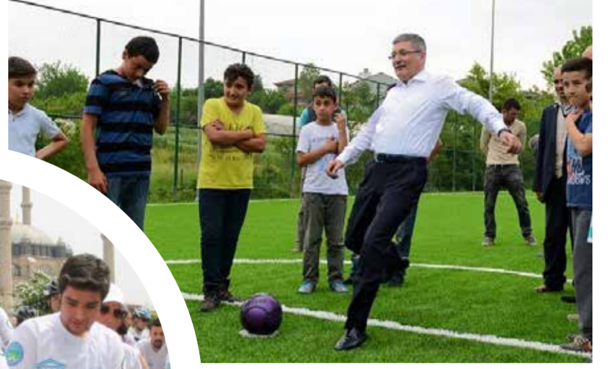
Pendik Belediye Başkanı Kenan Şahin