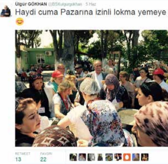
Çanakkale Belediye Başkanı Ülgür Gökhan