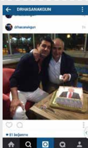
Büyükçekmece Belediye Başkanı Dr. Hasan Akgün