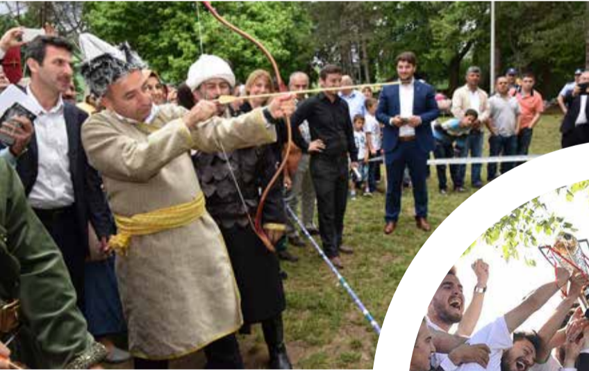
Kartepe Belediye Başkanı Hüseyin Üzülmöz