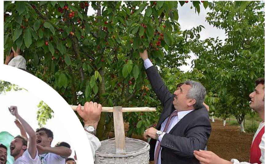
Körfez Belediye Başkanı İsmail Baran