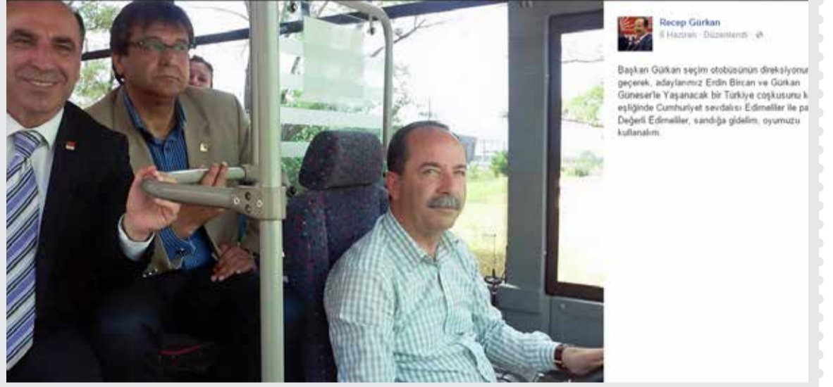
Edirne Belediye Başkanı Recep Gürkan