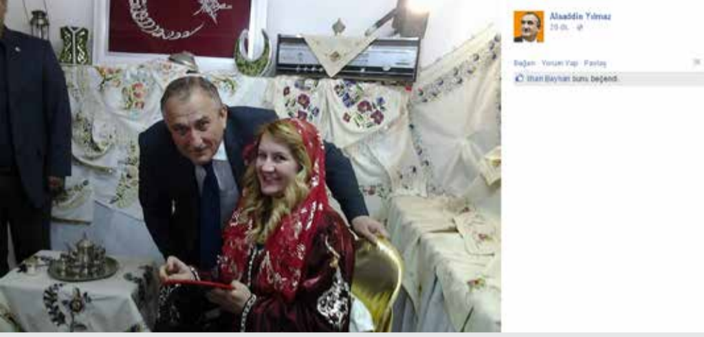
Bolu Belediye Başkanı Alaaddin Yılmaz