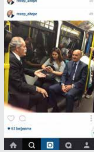
Bursa Büyükşehir Belediye Başkanı Recep Altepe