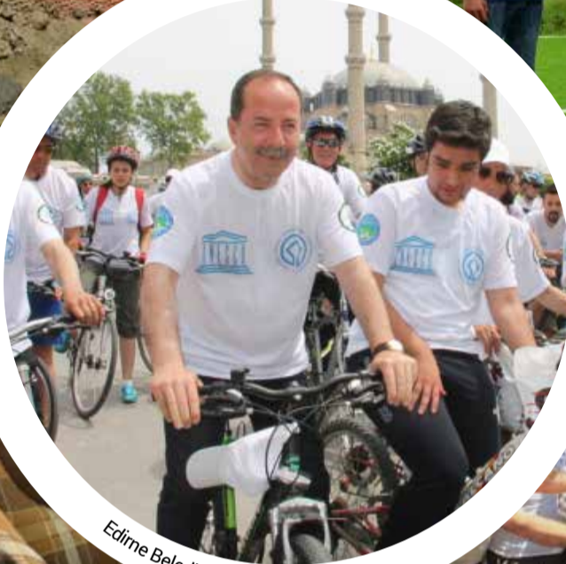
Edirne Belediye Başkanı Recep Gürkan