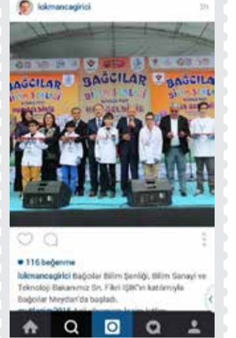
Bağcılar Belediye Başkanı Lokman Çağırıcı