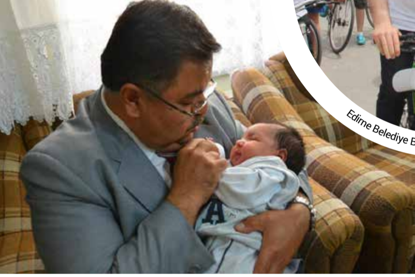
Bilecik Belediye Başkanı Selim Yağcı