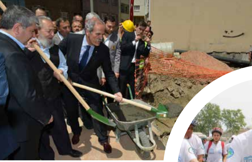
Bursa Büyükşehir Belediye Başkanı Recep Altepe

Yoğun çalışma tempolarına rağmen halkın içinden çıkmayan ve vatandaşla sıcak iletişim kuran belediye başkanlarının renkli yüzlerini sizlerle paylaşıyoruz.