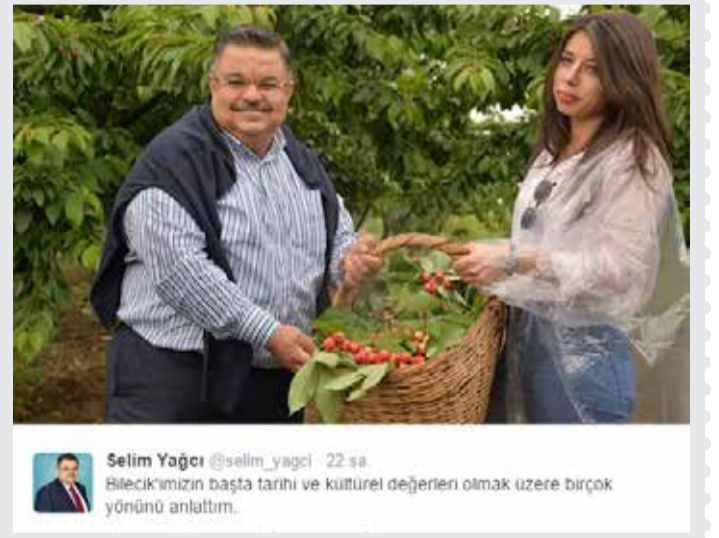
Bilecik Belediye Başkanı Selim Yağcı