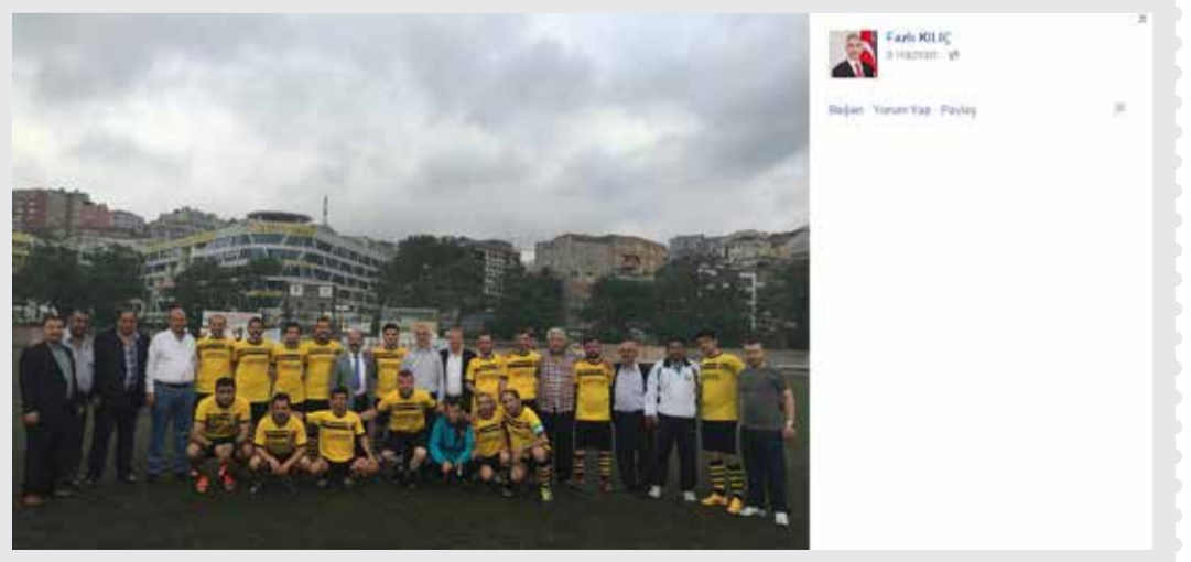
Kağıthane Belediye Başkanı Fazlı Kılıç