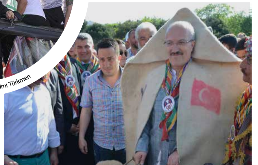
Altreyül Belediye Başkanı Zekai Kafaoğlu