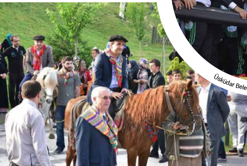
Yıldırım Belediye Başkanı İsmail Hakkı Edebalı