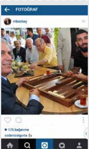
Nilüfer Belediye Başkanı Mustafa Bozbey