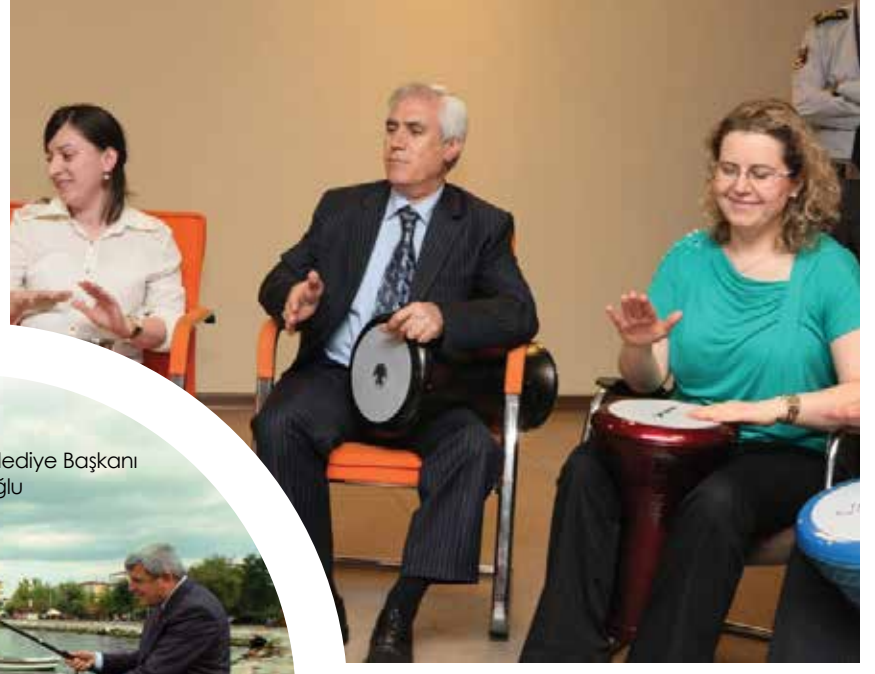
Nilüfer Belediye Başkanı Mustafa Bozbey