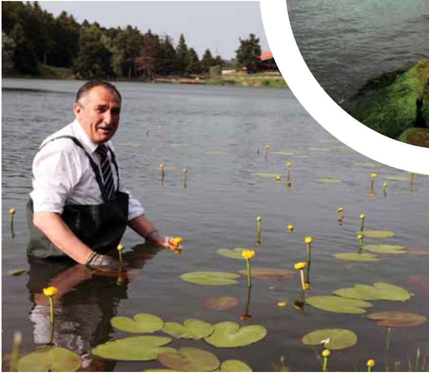
Bolu Belediye Başkanı Alaaddin Yılmaz