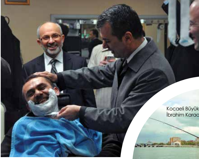
Eyüp Belediye Başkanı İsmail Kavuncu

Yoğun çalışma tempolarına rağmen halkın içinden çıkmayan ve vatandaşla sıcak iletişim kuran belediye başkanlarımızın hayata dair fotoğraflarını yayınlıyor, devamını belediyelerimizden bekliyoruz.