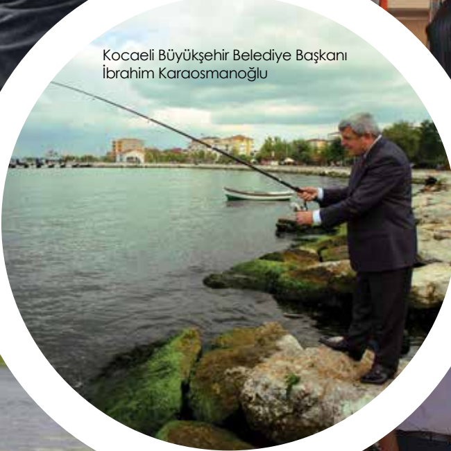
Kocaeli Büyükşehir Belediye Başkanı İbrahim Karaosmanoğlu