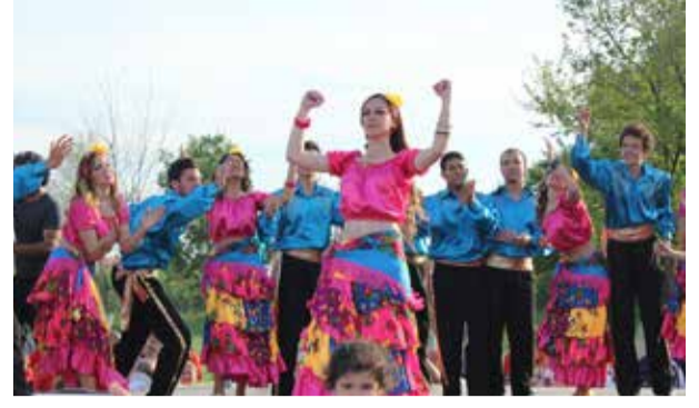
Kakava Hıdırellez Şenliği de Edirne'nin bir başka farklılığı.