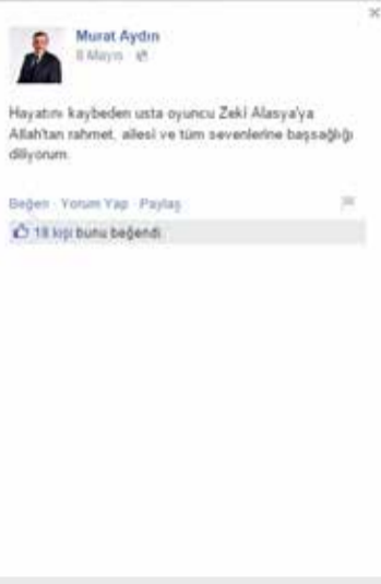
Zeytinburnu Belediye Başkanı Murat Aydın