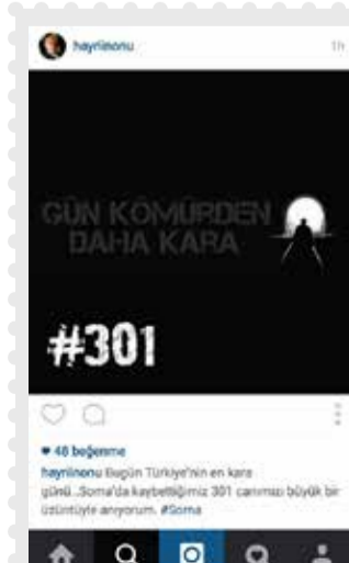
Şişli Belediye Başkanı Hayri İnönü