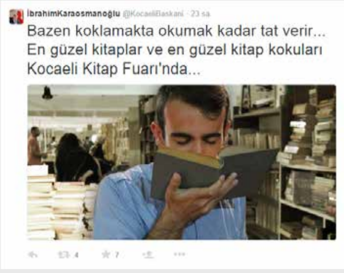
Kocaeli Büyükşehir Belediye Başkanı Ibrahim Karaosmanoğlu