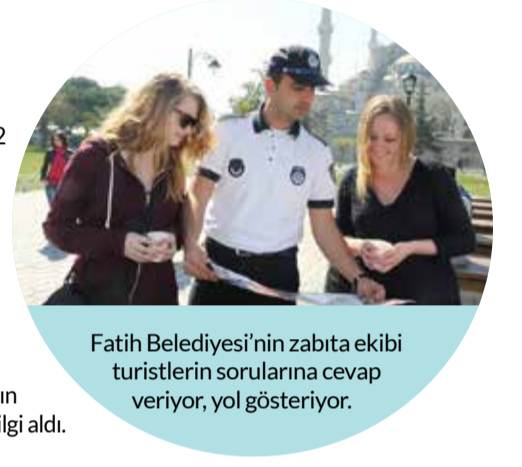
Fatih Belediyesi'nin zabıta ekibi turistlerin sorularına cevap veriyor, yol gösteriyor.

veriyor. Ayrıca Turizm Zabıtası'na ait 517 02 02 numaralı telefon numarasına bırakılan şikâyet ve talepler de anında değerlendirilerek çözüme ulaştırılıyor. Fatih Belediye Başkanı Mustafa Demir, geçtiğimiz günlerde zabıta ekibi ile bir araya geldi çalışmaların gidişatı hakkında detaylı bilgi aldı.