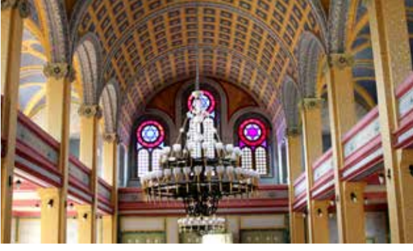
Avrupa'nın en büyük ikinci sinagogu Edirne'de bulunuyor.