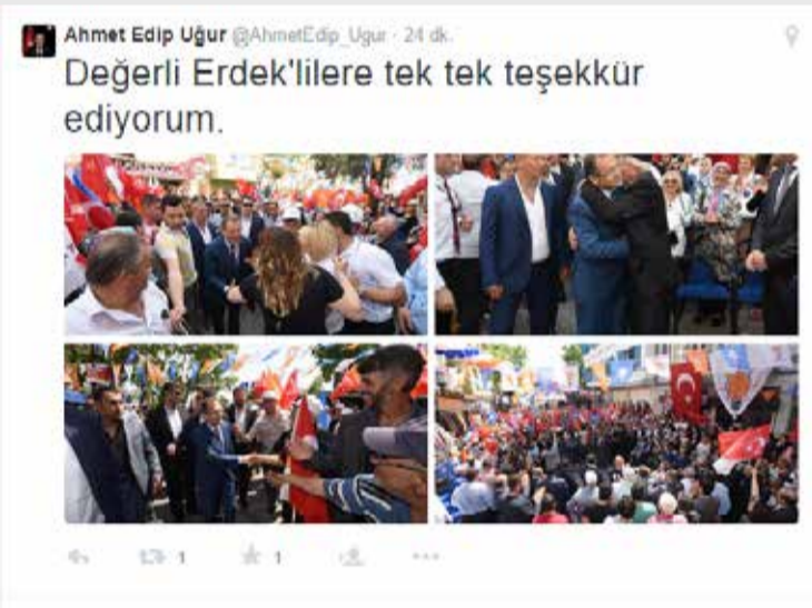
Balıkesir Büyükşehir Belediye Başkanı Ahmet Edip Uğur