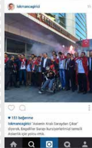
Bağcılar Belediye Başkanı Lokman Çağırıcı