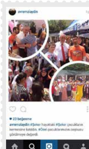
Eyüp Belediye Başkanı Remzi Aydın