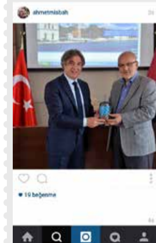
Beyoğlu Belediye Başkanı Ahmet Misbah Demircan