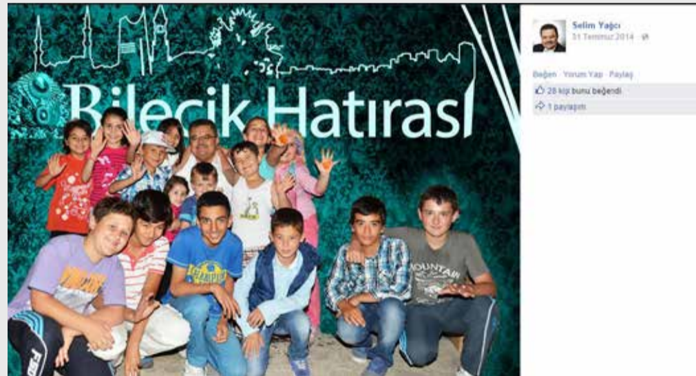
Bilecik Belediye Başkanı Selim Yağcı