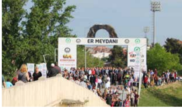
Kırkpınar ve Sarayıç Er Meydanı Türk kültürünün vazgeçilmezi.