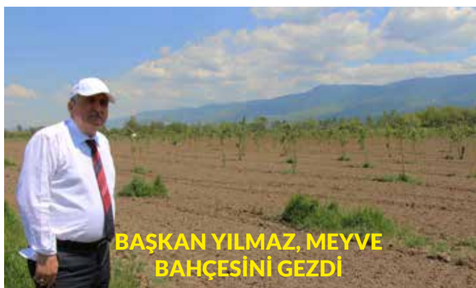
BAŞKAN YILMAZ, MEYVE BAHÇESİNİ GEZDİ

bebeğe bir ağaç dikilerek oluşturulan bahçede yılda ortalama 3 bin 500 ağaç dikiliyor. Bebek Meyve Bahçesi ile ilgili konuşan Bolu Belediye Başkanı Alaaddin Yılmaz ise; "Bu proje tüm Türkiye'de sadece Bolu'da olan bir proje. 2013 yılından itibaren çalışmalarını sürdürdüğümüz bu proje ile Bolu'da doğan her bebeğin adına burada bir meyve fidanı dikiyoruz. Bolu'da yılda ortalama 3 bin 500 ve üzerinde bebek dünyaya geliyor ve hepsinin adına burada bir ağaç bulunmakta. Burada isimlerine ağaç dikilen bebeklerin yıllar sonra torunları bile bu ağaçlardan meyve yiyebilecekler" dedi.