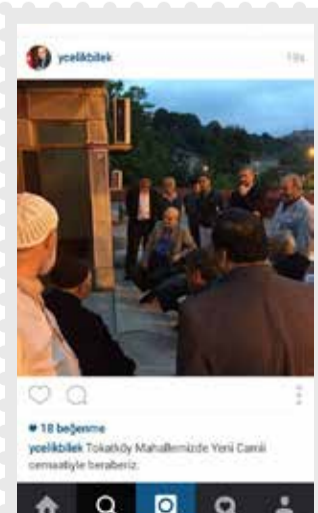
Beykoz Belediye Başkanı Yücel Çelikbilek