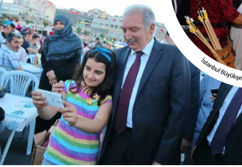
Başakşehir Belediye Başkanı Mevlüt Uysal