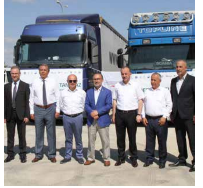
Marmara Belediyeler Birliği ve Türk Kızılay'ı Üsküp'te yaşanan felaketin ardından yardıma hazır olduklarını belirtti