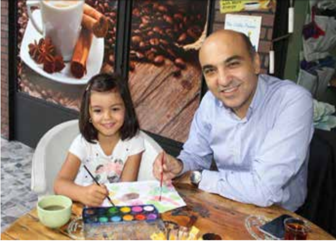
BÜLENT KERİMOĞLU /BaskanBulentKerimoglu Sanatı da çocuklarla vakit geçirmek kadar seven Bakırköy Belediye Başkanı Bülent Kerimoğlu, Hande Sanat Cafe'de minik yeteneklerle resim yapıyor.