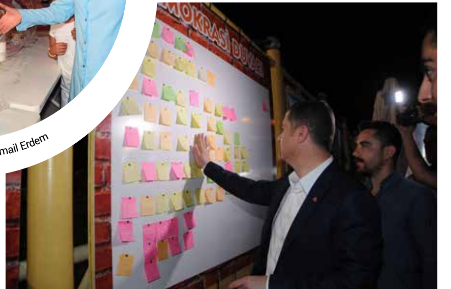
Çan Belediye Başkanı Abdurrahman Kuzu