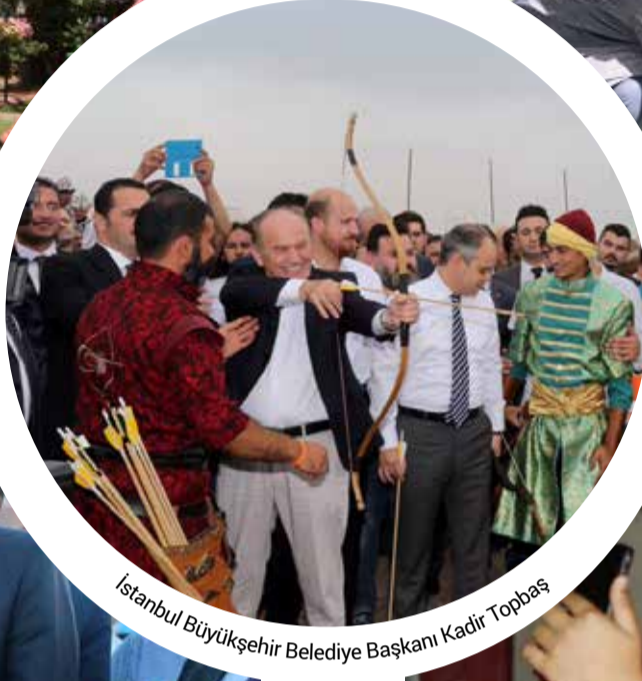
Istanbul Büyükşehir Belediye Başkanı Kadir Topbaş