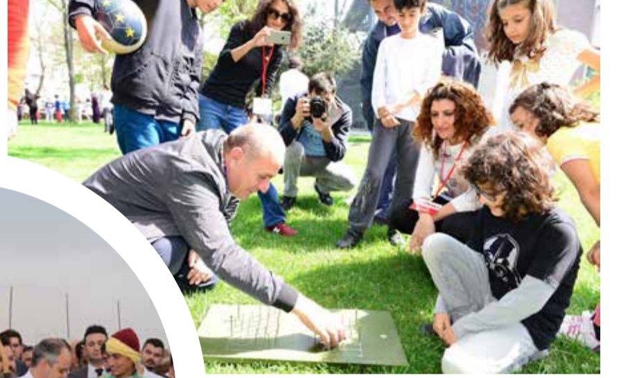
Kadıköy Belediye Başkanı Aykurt Nuhoğlu