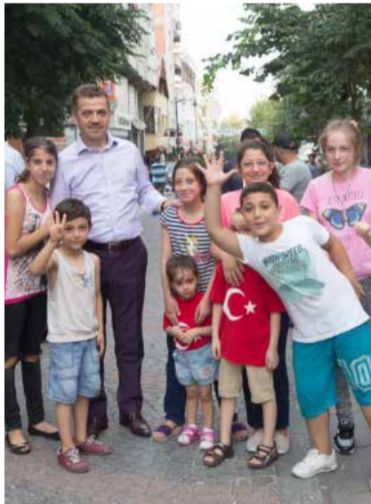
HASAN TAHSİN USTA @htahsinusta Gaziosmanpaşa Belediye Başkanı Hasan Tahsin Usta, esnafı ziyaret ederek mahallenin çocuklarıyla bir araya geldi.

Türkiye'deki aktif sosyal medya kullanıcısı 42 milyon. Türkiye nüfusunun yüzde 90'ının mobil aboneliği bulunuyor. Türkiye'deki aktif sosyal medya kullanıcı sayısı ise geçtiğimiz yıla göre yüzde 5 artış gösterdi.