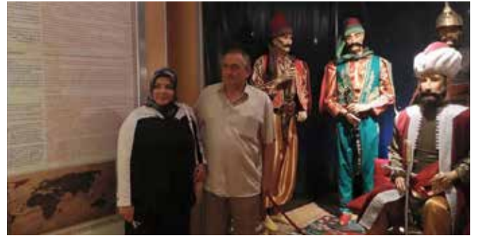
ALAADDİN YILMAZ /alaaddinyilmazbolu Bolu Belediye Başkanı Alaaddin Yılmaz, katıldığı Kosova ve Ma-muşa ziyaretleriyle tarihin tozlu sayfalarında yolculuğa çıkarak bu anı ölümsüzleştiriyor.