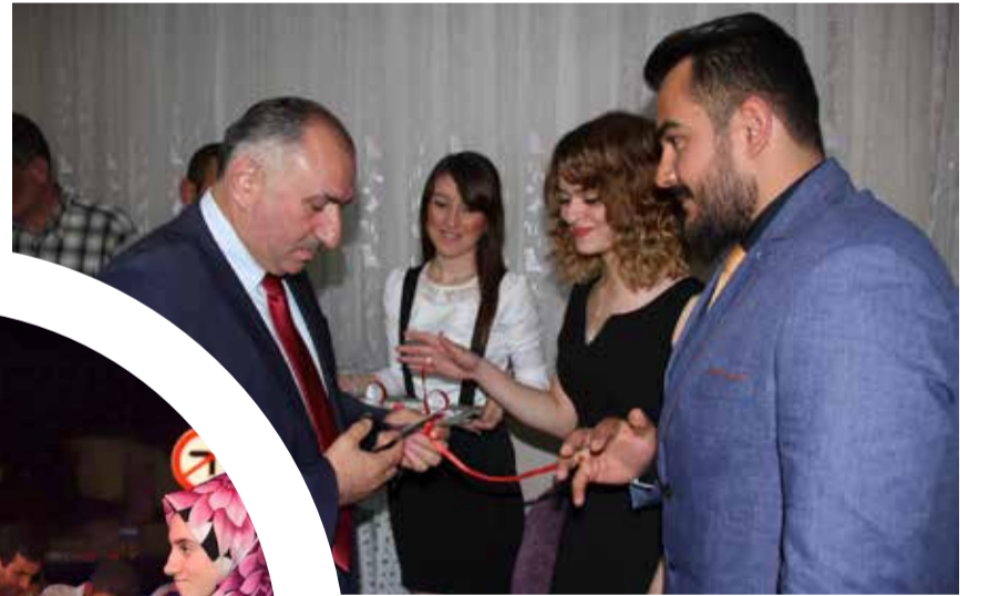
Orhangazi Belediye Başkanı Neşet Çağlayan