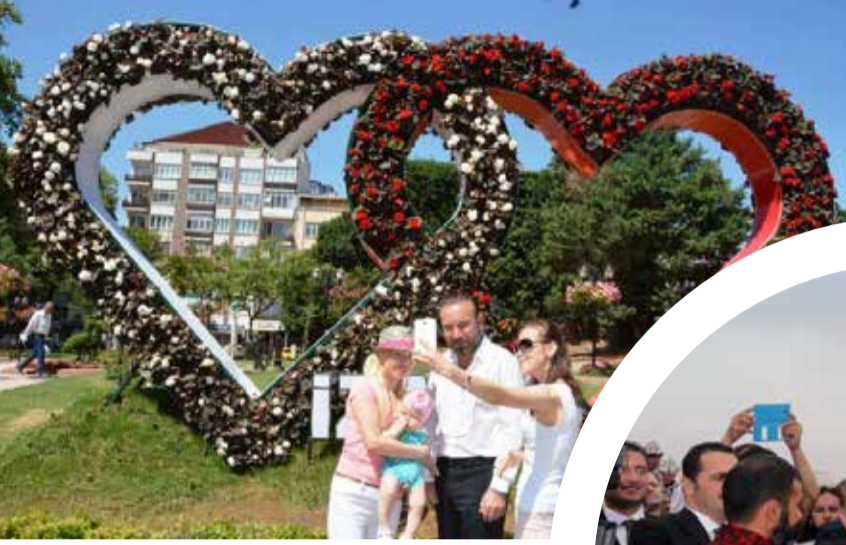
Izmit Belediye Başkanı Nevzat Doğan

Yoğun çalışma tempolarına rağmen halkın içinden çıkmayan ve vatandaşla sıcak iletişim kuran belediye başkanlarının renkli yüzlerini sizlerle paylaşıyoruz.