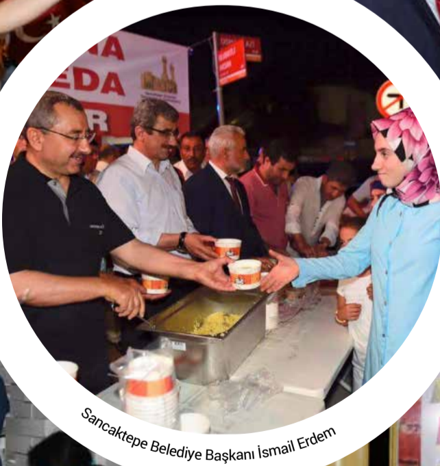
Sancaktepe Belediye Başkanı İsmail Erdem