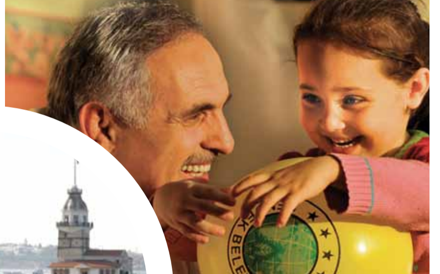
Hendek Belediye Başkanı Ali İnci