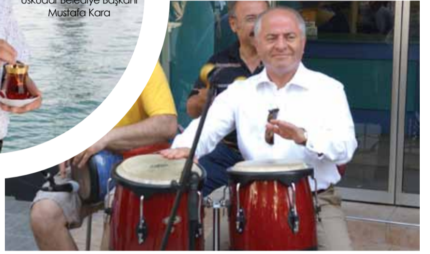
Kadıköy Belediye Başkanı Selami Öztürk