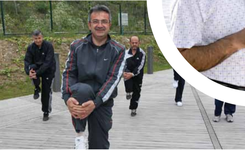
Gebze Belediye Başkanı Adnan Köşker