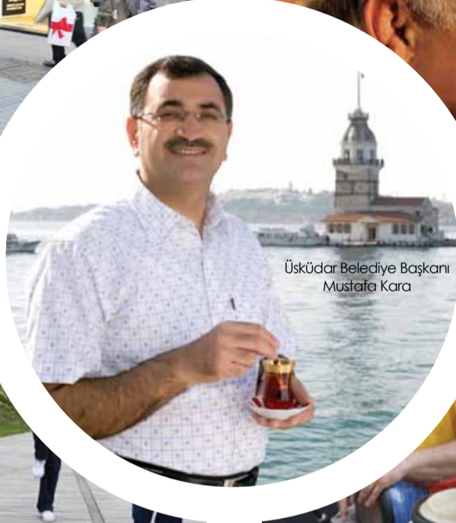
Üsküdar Belediye Başkanı Mustafa Kara