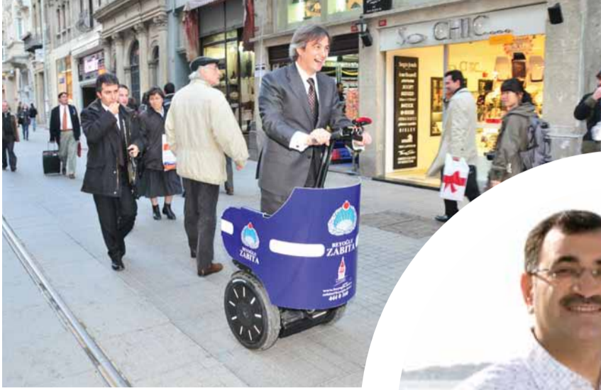
Beyoğlu Belediye Başkanı Ahmet Misbah Demircan

Yoğun çalışma tempolarına rağmen halkın içinden çıkmayan ve vatandaşla sıcak iletişim kuran belediye başkanlarımızın hayata dair fotoğraflarını yayınlıyor, devamını belediyelerimizden bekliyoruz. fatih.sanlav@marmara.gov.tr