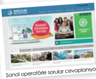
Sanal operatörle sorular cevaplanıyor

masına şöyle devam etti: "Bağcılar Belediyesi olarak, Elektronik Belge Yönetim Sistemi (EBYS), Sanal Operatör uygulaması, Kayıtlı Elektronik Posta Sistemi (KEP) ve İnteraktif Meclis uygulamaları ile