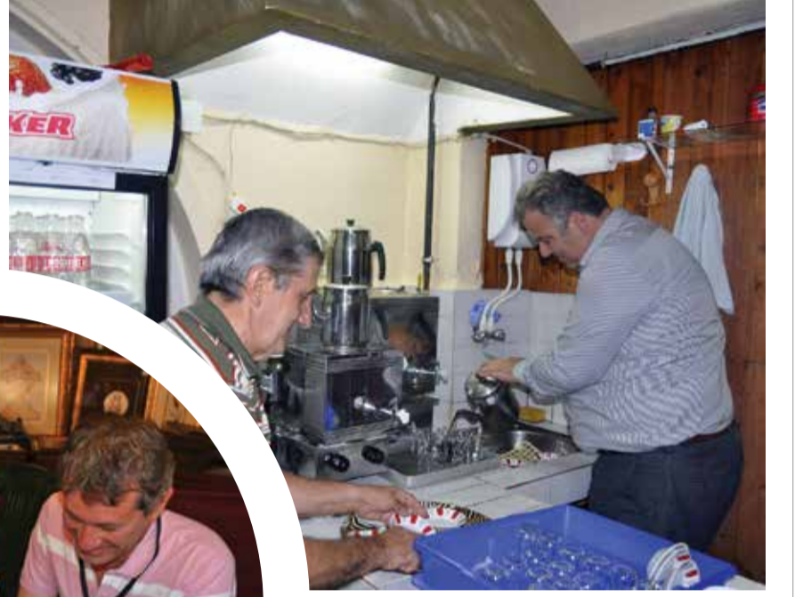
Derince Belediye Başkanı Aziz Alemdar