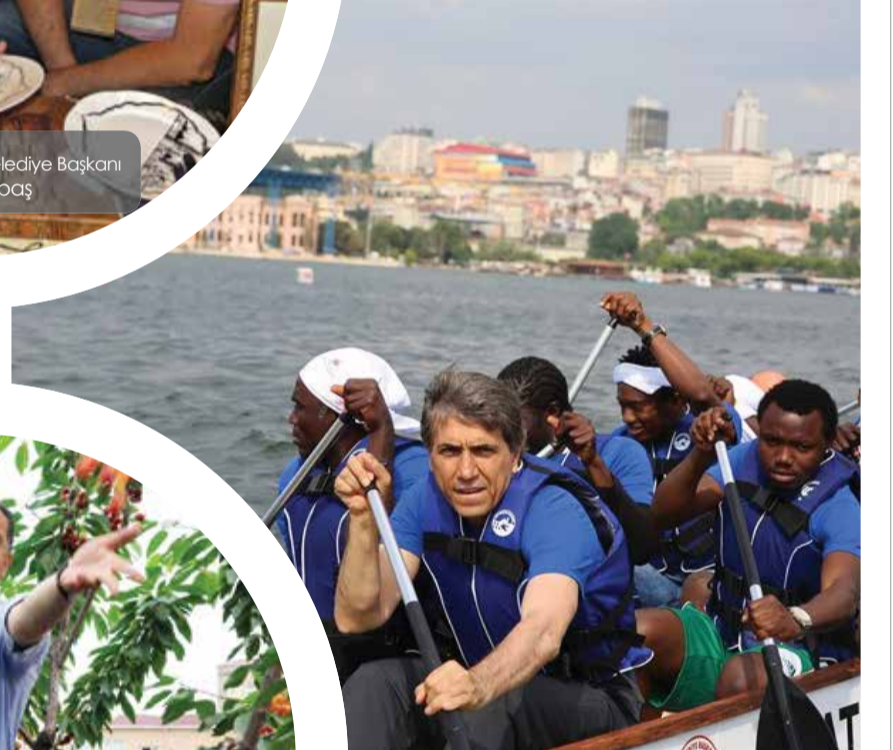
Fatih Belediye Başkanı Mustafa Demir