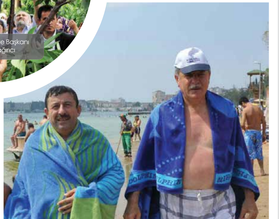
Darca Belediye Başkanı Şükrü Karabacak Kocaeli Büyükşehir Belediye Başkanı İbrahim Karaosmanoğlu