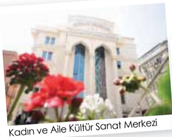
Kadın ve Aile Kültür Sanat Merkezi

Mehmet Akif Ersoy Kültür Sanat Merkezi ve Müzemiz, Mahmutbey Kültür Merkezimiz son birkaç yıl içerisinde tamamlanan ve hizmet vermeye baş-