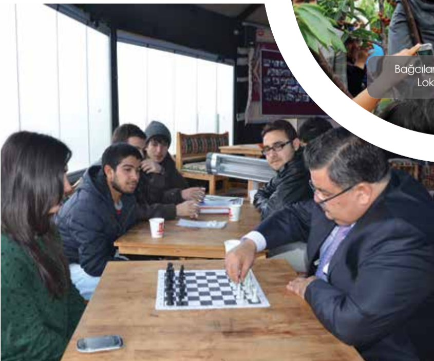
Bilecik Belediye Başkanı Selim Yağcı