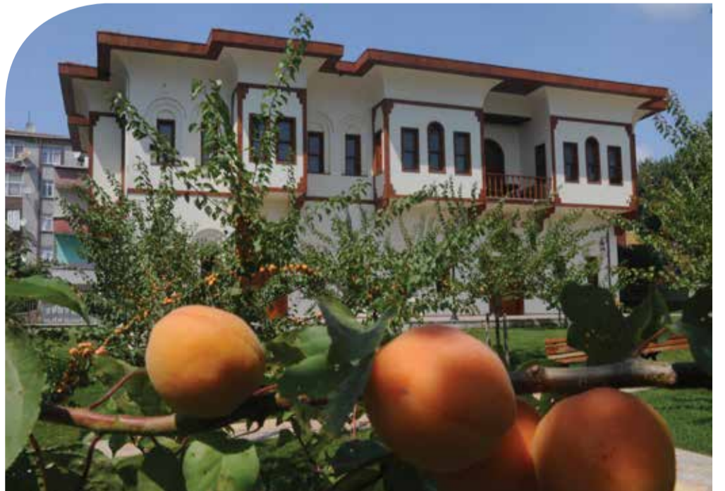
Bağcılar Belediyesi'nin Kayısı Bahçesi'nden bir kare..

lefonumdan takip edebiliyorum. İmzalanması gereken evraklar varsa, nerede olursam olayım