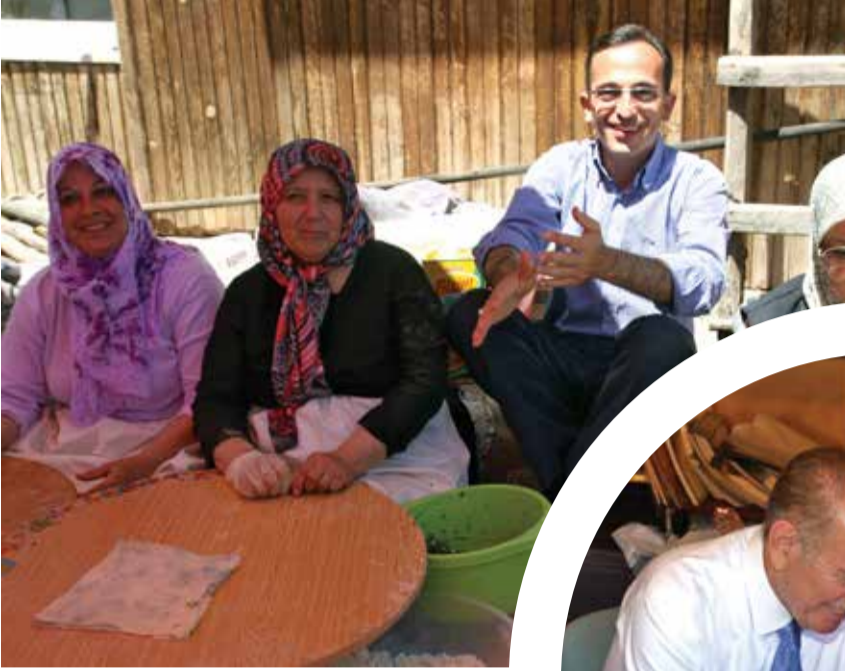
Şile Belediye Başkanı Can Tabakoğlu

Yoğun çalışma tempolarına rağmen halkın içinden çıkmayan ve vatandaşla sıcak iletişim kuran belediye başkanlarımızın hayata dair fotoğraflarını yayınlıyor, devamını belediyelerimizden bekliyoruz.