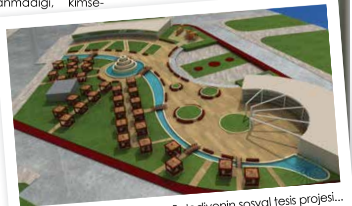
Belediyenin sosyal tesis projesi...

Yürüttüğümüz yoğun altyapı çalışmalarını halkımızın sorunlarını en aza indirmeye çalışırken Pamukova'ya değer katacak projeler için de çalışmalarımızı sürdürüyoruz. Bunlardan biri içme suyu ve kanalizasyon arıtma tesisi.