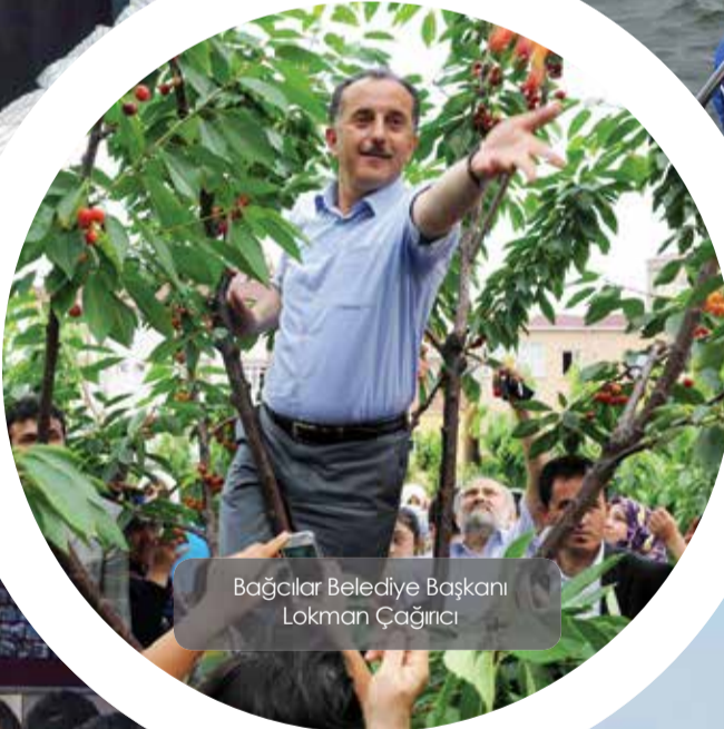
Bağcılar Belediye Başkanı Lokman Çağırıcı