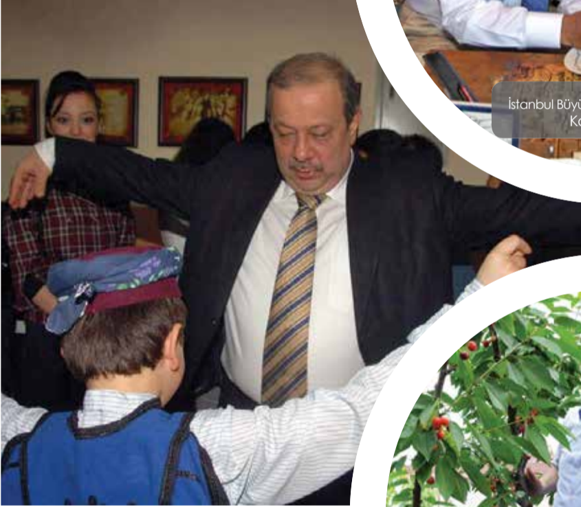
Bahçelievler Belediye Başkanı Osman Develioğlu