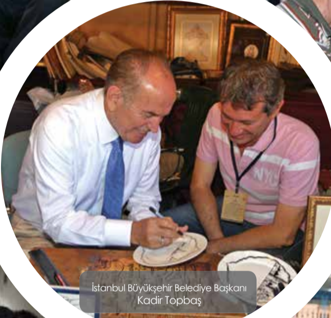
Istanbul Büyükşehir Belediye Başkanı Kadir Topbaş