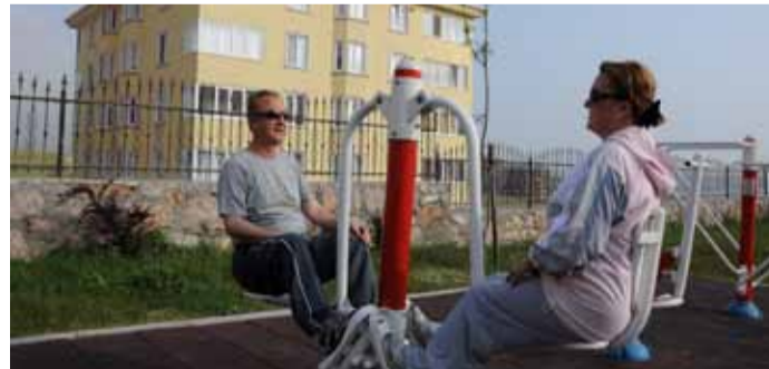
Bandırma Belediye Başkanı Sedat Pekel ve Eşi Feride Pekel, güne her sabah yürüyüş ve spor yaparak başlıyor.

Önüme koyduğum amaçlara ulaşmak benim için önemlidir.