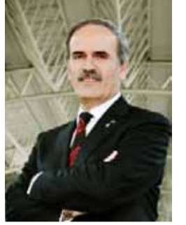
Recep ALTEPE Birlik Başkanı Bursa Büyükşehir Belediye Başkanı

Marmara Bölgesi'nde ve Türkiye genelinde yüzlerce kurumla işbirliği halinde yaptığımız eğitimler, ülkemizde belediyeciliğin gelişmesine büyük katkı sağladır. Yanımızda olan