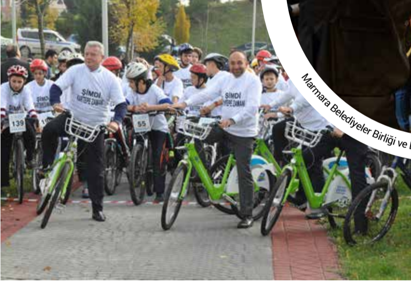
Kartepe Belediye Başkanı Hüseyin Üzülmaz