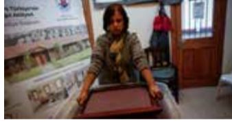
Elde edilen A3 ve A4 boyutundaki kalıplar suda ıslatılıyor.