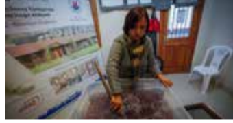
Küçük parçalara ayrıldıktan sonra hamur makinesine atılıp çalıştırılıyor.