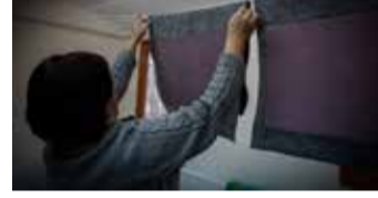
Suda ıslatılan kalıplar sonrasında kurumaya bırakılıyor.