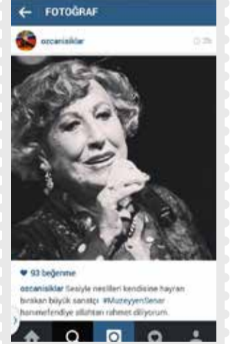
Silivri Belediye Başkanı Özcan Işıklar