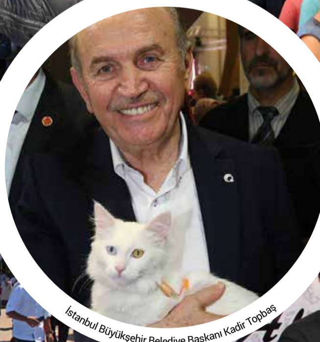
İstanbul Büyükşehir Belediye Başkanı Kadir Topbaş