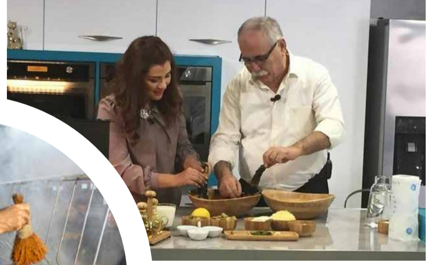
Çanakkale Belediye Başkanı Ülgür Gökhan