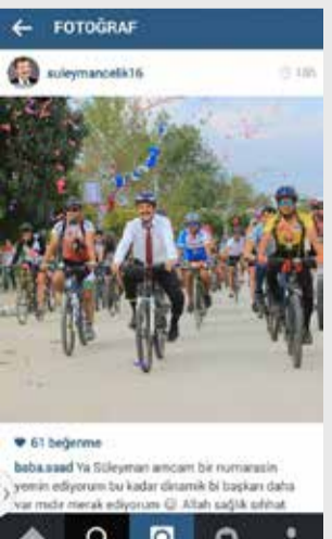
Yenişehir Belediye Başkanı Süleyman Çelik