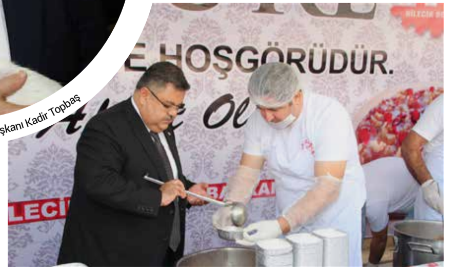
Bilecik Belediye Başkanı Selim Yağcı