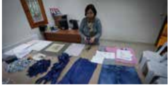
Önce eski kot pantolonlar küçük parçalara ayrılıyor.