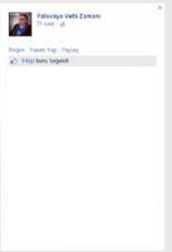
Yalova Belediye Başkanı Vefa Salman