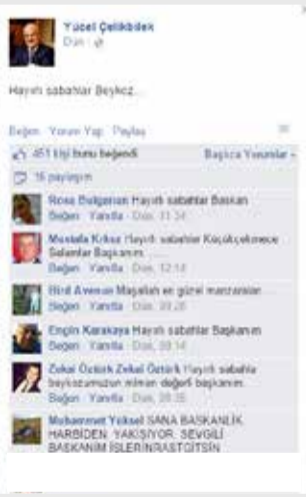
Beykoz Belediye Başkanı Yücel Çelikbilek