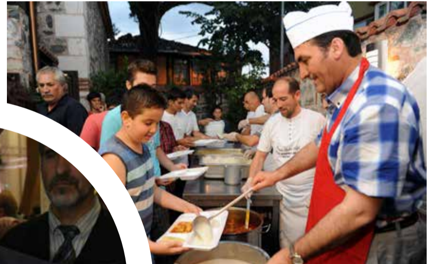
Osmangazi Belediye Başkanı Mustafa Dündar