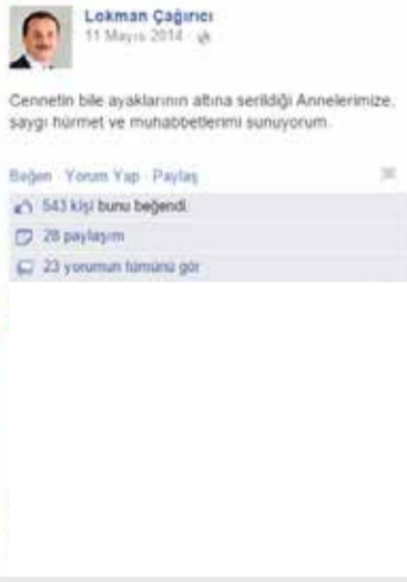
Bağcılar Belediye Başkanı Lokman Çağırıcı