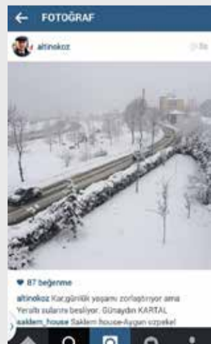
Kartal Belediye Başkanı Altınok Öz