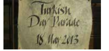
Ve sonunda el yapımı atık kottan yapılan kağıdımız kullanıma hazır.