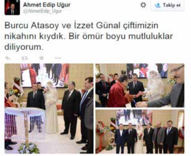
Balıkesir Büyükşehir Belediye Başkanı Ahmet Edip Uğur