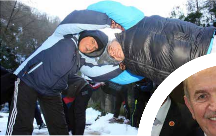
Kocaeli Büyükşehir Belediye Başkanı İbrahim Karaosmanoğlu