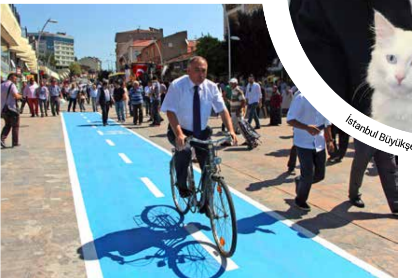
Bolu Belediye Başkanı Alaaddin Yılmaz