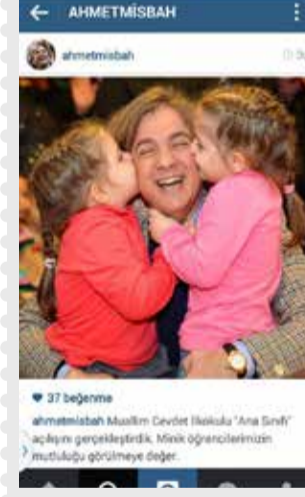
Beyoğlu Belediye Başkanı Ahmet Misbah Demircan