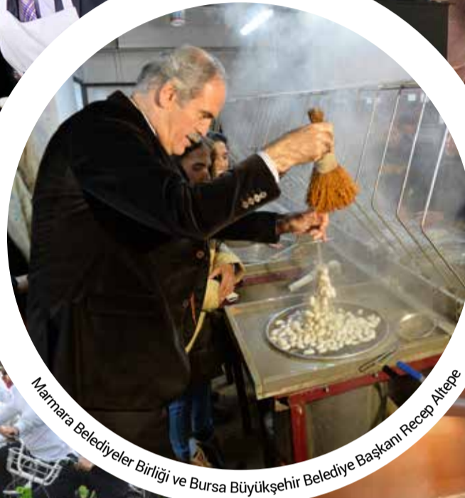
Marmara Belediyeler Birliği ve Bursa Büyükşehir Belediye Başkanı Recep Altepe