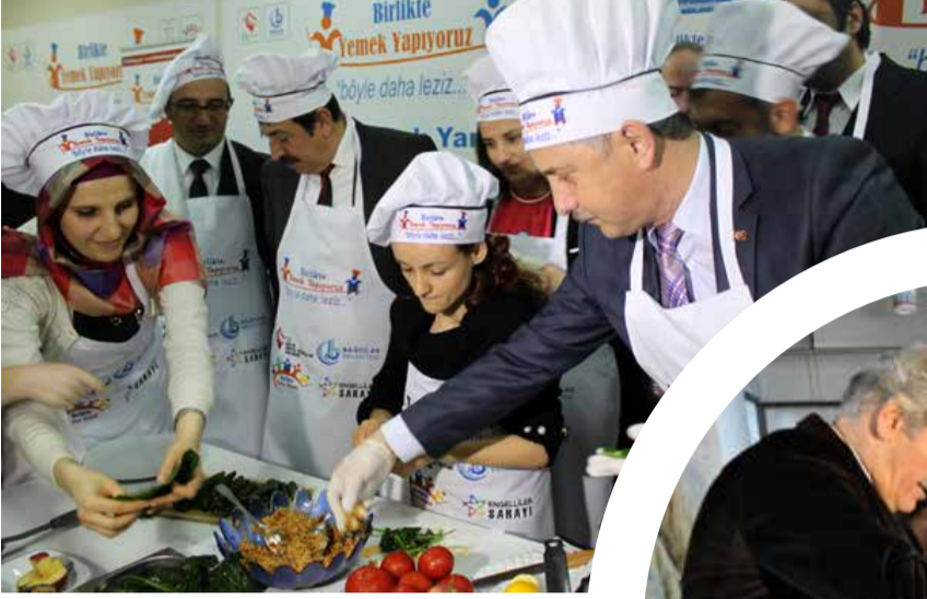
Bağcılar Belediye Başkanı Lokman Çağırıcı

Yoğun çalışma tempolarına rağmen halkın içinden çıkmayan ve vatandaşla sıcak iletişim kuran belediye başkanlarının renkli yüzlerini sizlerle paylaşıyoruz.