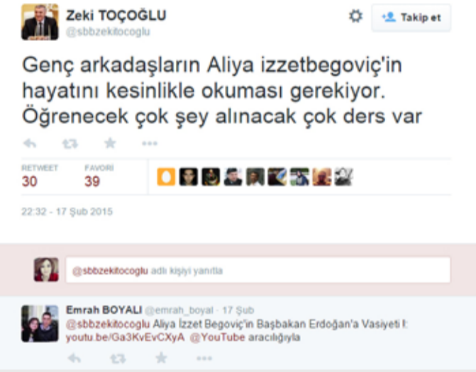
Sakarya Büyükşehir Belediye Başkanı Zeki Toçoğlu