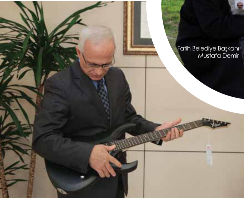
Maltepe Belediye Başkanı Mustafa Zengin