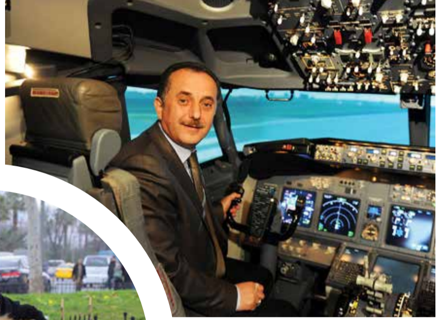
Bağcılar Belediye Başkanı Lokman Çağırıcı