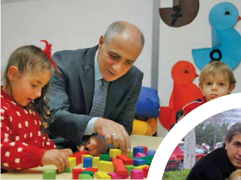
Çayırova Belediye Başkanı Ziyaettin Akbaş

Yoğun çalışma tempolarına rağmen halkın içinden çıkmayan ve vatandaşla sıcak iletişim kuran belediye başkanlarımızın hayata dair fotoğraflarını yayınlıyor, devamını belediyelerimizden bekliyoruz.