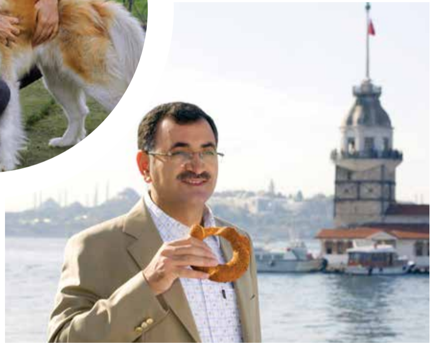
Üsküdar Belediye Başkanı Mustafa Kara