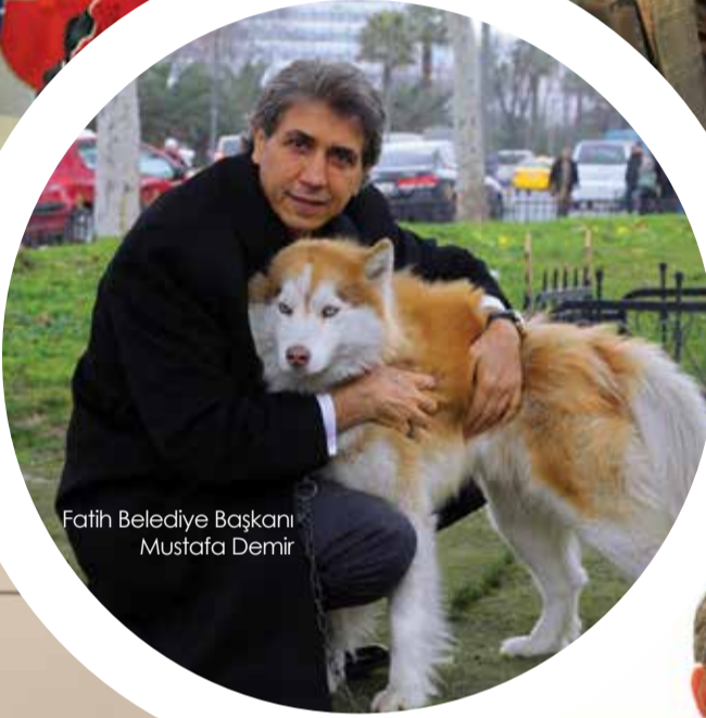
Fatih Belediye Başkanı Mustafa Demir