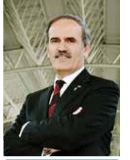
Recep ALTEPE Birlik Başkanı Bursa Büyükşehir Belediye Başkanı

Nisan ayının son haftasında Bursa Hilton'da gerçekleştireceğimiz 2013 Yılı 1. Olağan Genel Kurulumuzun da hayırlara vesile olmasını niyaz ediyorum.