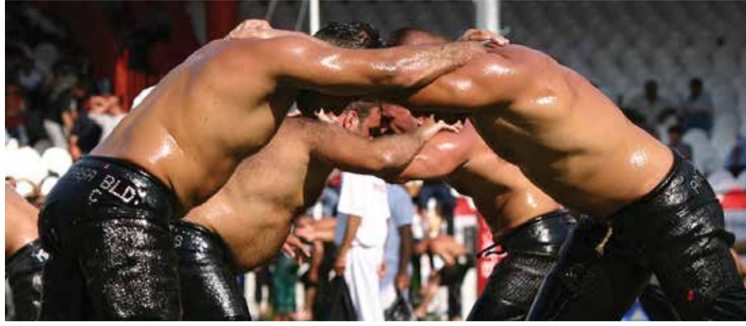
Edirne'nin simgesi olan Tarihi Kırkpınar Yağlı Güreşleri ve Kültür Etkinlikleri Festivali'nin her ayrıntısı dijital ortama aktarılacak.

Edirne Belediyesi tarafından her yıl düzenlenen "Tarihi Kırkpınar Yağlı Güreşleri ve Kültür Etkinlikleri Festivali"nin 652'ncisi bu yıl 1-7 Temmuz 2013 tarihleri arasında Edirne'de kutlanacak. Edirne Belediye Başkanlığı, Kültür ve Turizm Bakanlığı'nın ortak yürüttüğü proje ile UNESCO'nun Somut Olmayan Kültürel Miras Listesi'ne dahil olan "Tarihi Kırkpınar Yağlı Güreşleri Festivali"ni gelişen bilgi teknolojileri aracılığıyla tüm dünya ülke-