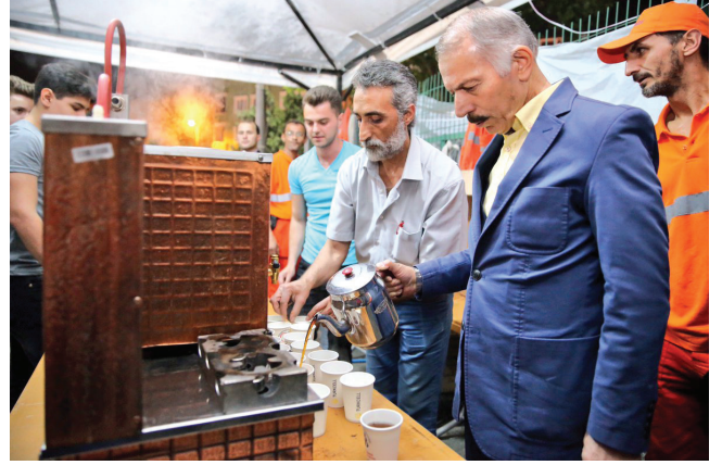
Atilla Aydın Bayrampaşa Belediye Başkanı