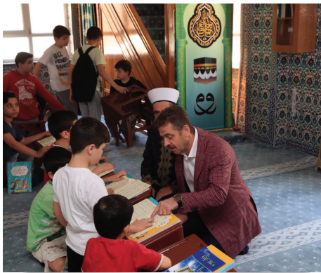
Gaziosmanpaşa Belediye Başkanı Hasan Tahsin Usta @htahsinusta "Çocuklarınızı, peygamberimizi, ehl-i beyti ve Kur'an okumayı sevmek gibi üç özelliğe terbiye ediniz." Kenzül-İrfân; 192/441