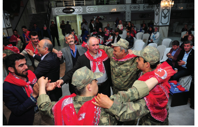
Neşet Çağlayan Orhangazi Belediye Başkanı