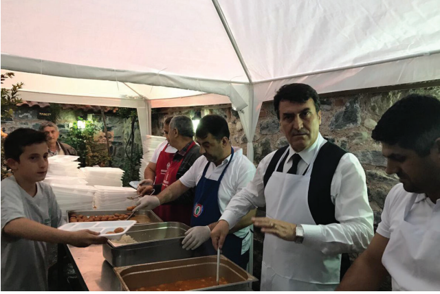
Mustafa Dündar Osmangazi Belediye Başkanı