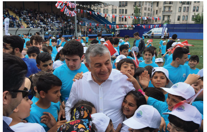
Şükrü Genç Sarıyer Belediyesi Başkanı