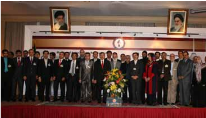
Asya Belediye Başkanları toplantısı, Tahran

Yukarıdaki örneğin ışığında, yurt dışı çalışmaları bulunan merkezi idare kurumlarını ve yerel yönetimleri ile birliklerini bir araya getirecek, sekreteryanının Türkiye Belediyeler Birliği veya Türk İşbirliği ve Kalkınma İdaresi tarafından üstlenilebileceği bir koordinasyon platformu kurulmalı. Halihazırda, herkesin adeta "kendi köşesinde" çalıştığı ve diğerlerinin faaliyetlerinden düzensiz bir biçimde, bazen de tesadüfen haber-