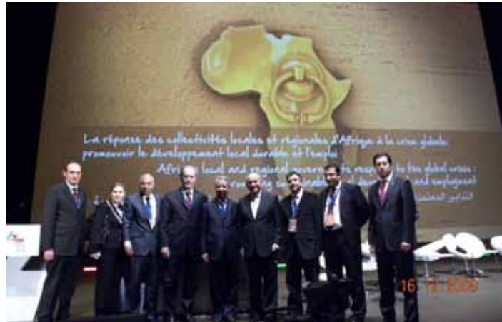
MBB Heyeti Afrika Şehirleri Zirvesinde

Türkiye’nin ulusal düzeydeki kurumlarının dış politikada son yıllarda gerçekleştirdikleri atılım ve açılımı, yerel yönetimlerin çalışmaları da desteklemeli. Zira, hedef ülkelerde halka en yakın yönetim düzeyi olan belediyeler üzerinden yurttaşlara nüfuz edeceklerinden, ayrıca, ilişkide buldukları yerel yöneticilerin kendi ulusal ve siyasi yönetimleri nezdinde önemli etki potansiyeli bulunduğundan, diplomatların ve hükümetin “dışarıdan” etkisinden farklı olarak, yerel yönetimlerin “içeriden” etki etme kabiliyeti var. Yerel yönetimlerin uluslararası çalışmalarının, ulusal dış politikayı tamamlayıcı önemli bir güç olduğu gerçeğini en iyi kavramış