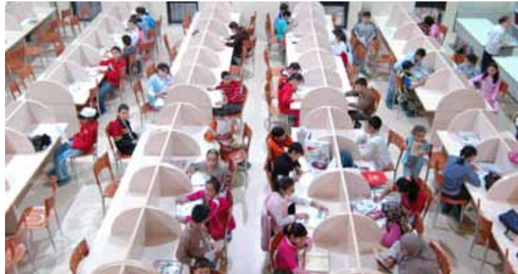
Bağcılar Kültür Merkezi