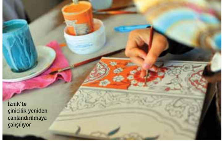
İznik'te çinicilik yeniden canlandırılmaya çalışılıyor

Tanıtım konusunda yardımcı oluyoruz. Bizim şu andaki en büyük hedefimiz dünyaya bu değerimizi tanıtmak. Bunun için fuarlara katılıyoruz. Ayrıca biz İznik Çinisi'nin patentini aldık. Şu anda İznik Çinisi'nin patenti İznik Belediyesi'nin