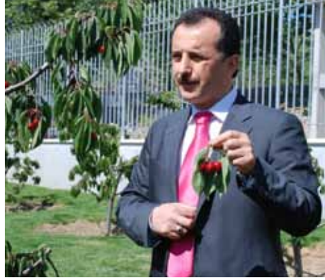
Bağcılar'da Kiraz Bahçesi

Bugün ise Belediye, gelişigüzel yapılanmış, İstanbul'un