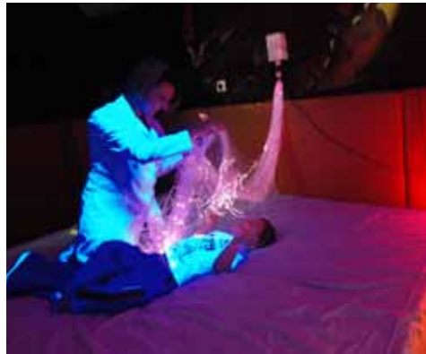
Engelliler Rehabilitasyon Merkezi'nden Bir Görüntü

Bahçelerde ağaçlar meyve vermeye başlamış. Henüz kiraz ve kayısı ağaçları küçük olsa da, üzüm bağı bir hayli verimli hale gelmiş. 2400 metrekare alan üzerine kurulan bağda, 220 adet fidan bu-