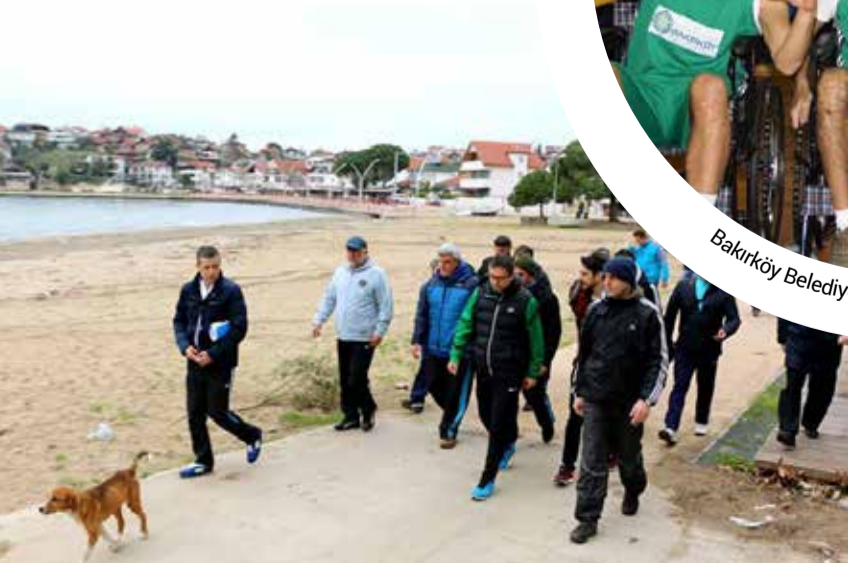
Kandıra Belediye Başkanı Ünal Köken