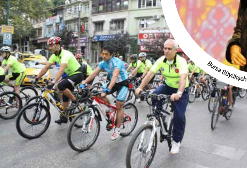
Nilüfer Belediye Başkanı Mustafa Bozbey