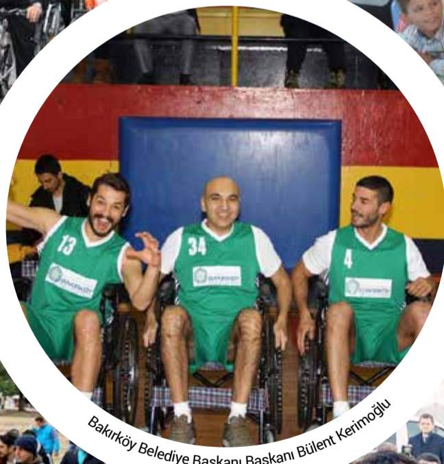
Bakırköy Belediye Başkanı Başkan Bülent Kerimoğlu