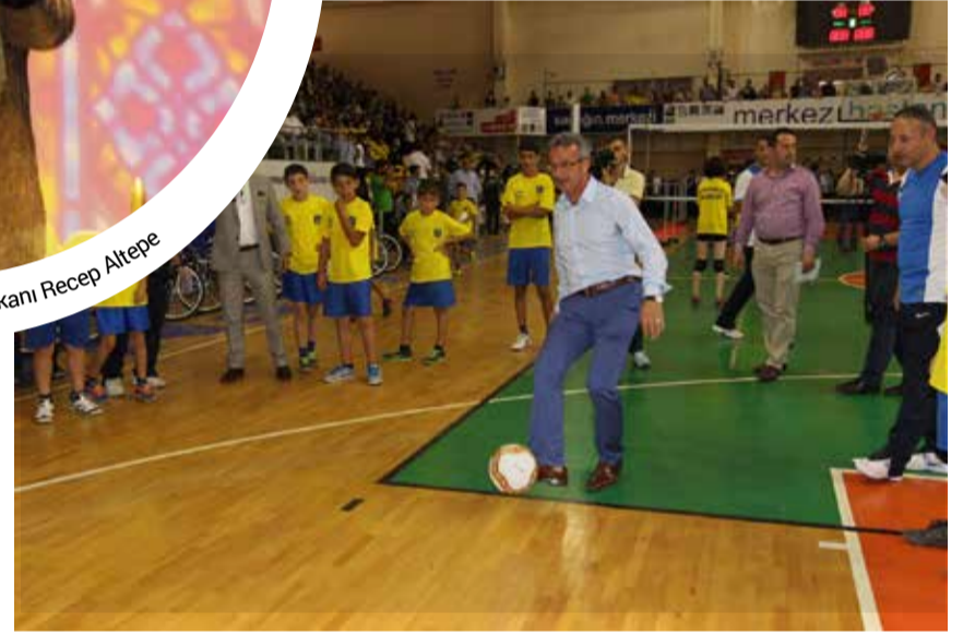
Gebze Belediye Başkanı Adnan Köşker