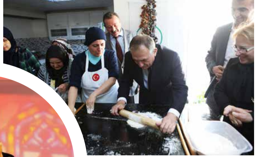
Bolu Belediye Başkanı Alaaddin Yılmaz