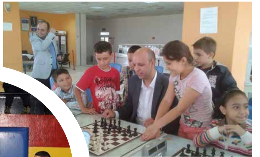
Hayrabolu Belediye Başkanı Fahmi Altayoğlu