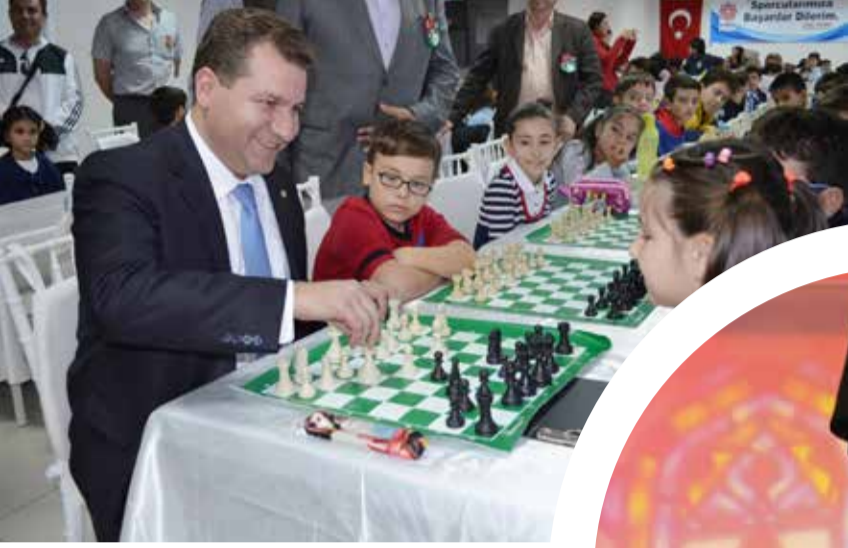
Karesi Belediye Başkanı Yücel Yılmaz

Yoğun çalışma tempolarına rağmen halkın içinden çıkmayan ve vatandaşla sıcak iletişim kuran belediye başkanlarının renkli yüzlerini sizlerle paylaşıyoruz.