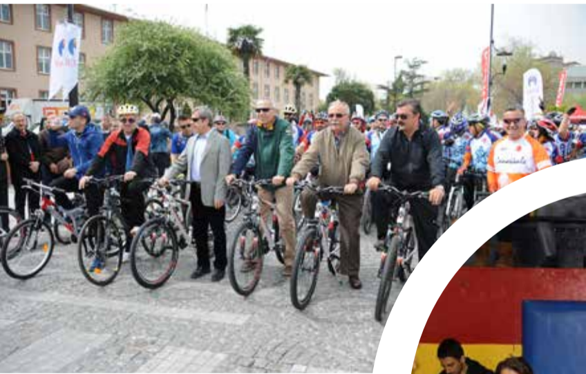
Çanakkale Belediye Başkanı Ülgür Gökhan