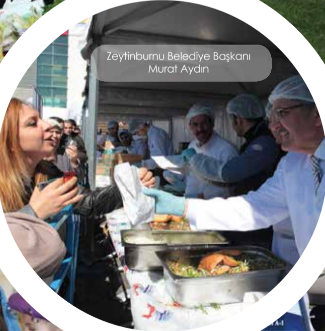
Zeytinburnu Belediye Başkanı Murat Aydın