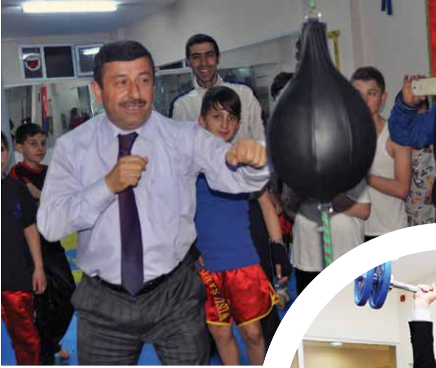
Darıca Belediye Başkanı Şükrü Karabacak

Yoğun çalışma tempolarına rağmen halkın içinden çıkmayan ve vatandaşla sıcak iletişim kuran belediye başkanlarımızın hayata dair fotoğraflarını yayınlıyor, devamını belediyelerimizden bekliyoruz.