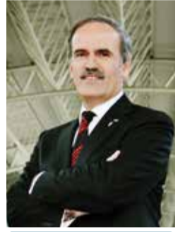
Recep ALTEPE Birlik Başkanı

Türkiye ve yakın coğrafyasında, belediyeçilik alanında demokratik, katılımcı, saydam, hesap veren, insan hak ve özgürlüklerini esas alan bir yerel yönetim anlayışının yerleşmesi ve yaygınlaşması için çaba göstermeye 2014-2019 döneminde de devam etme arzusundayız. Bu vesileyle yeni belediyeçilik döneminin hepimize hayırlar getirmesini diliyorum, saygılarımla sunuyorum.