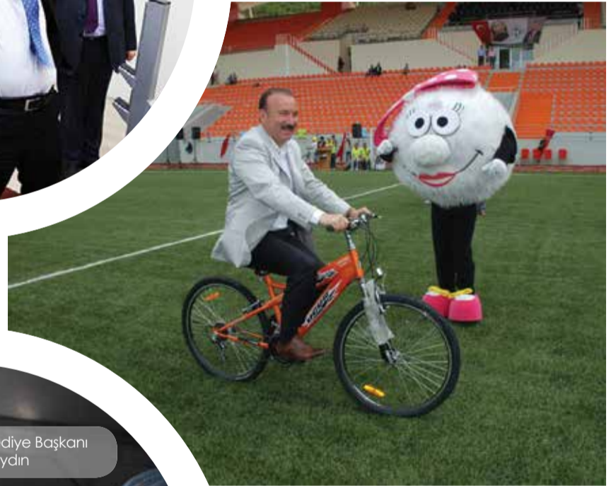
İzmit Belediye Başkanı Nevzat Doğan