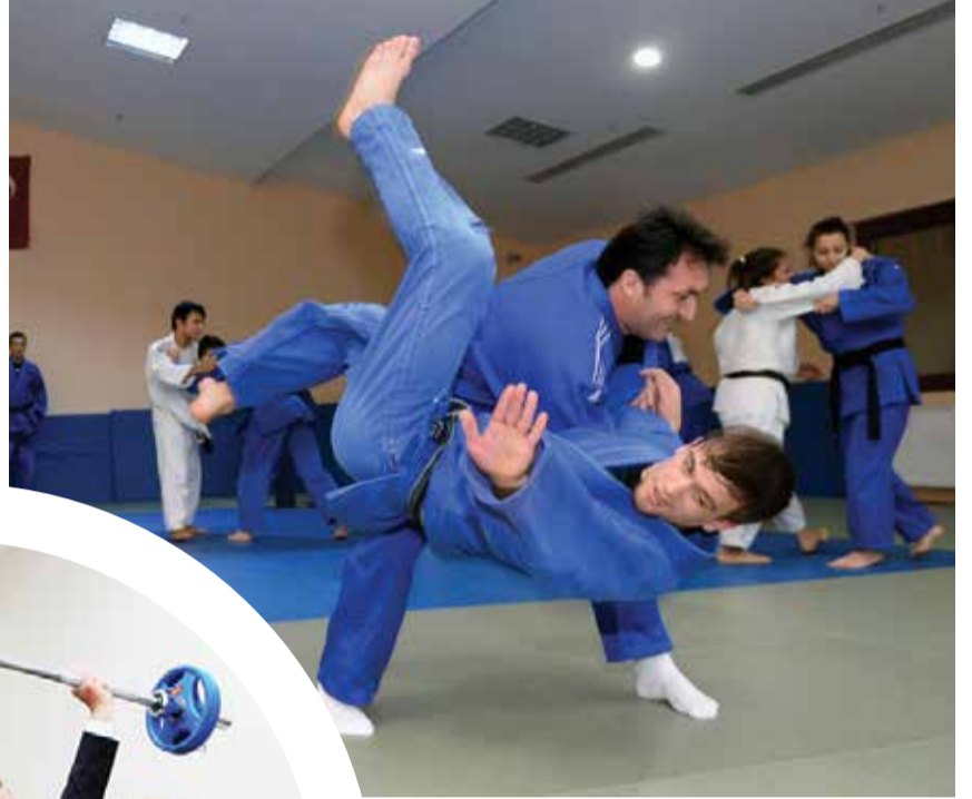
Osmangazi Belediye Başkanı Mustafa Dünder