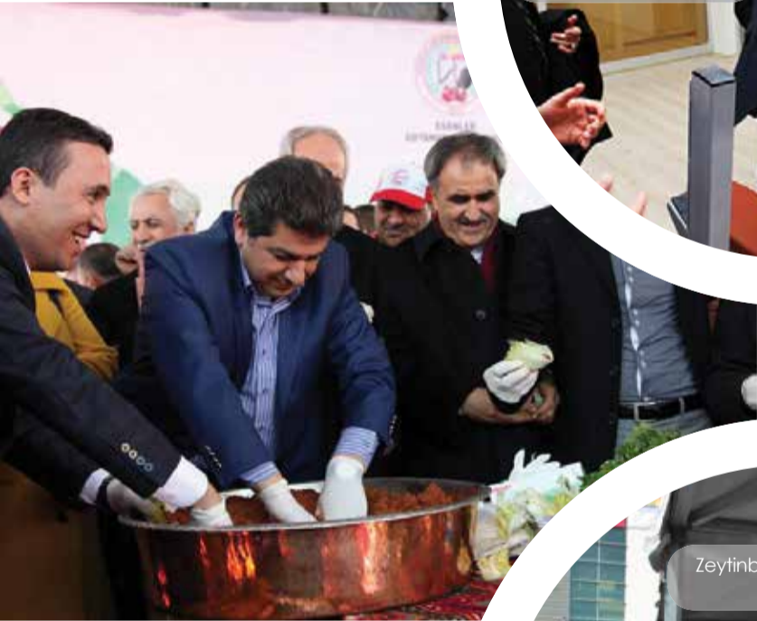
Esenler Belediye Başkanı Tevfik Göksu