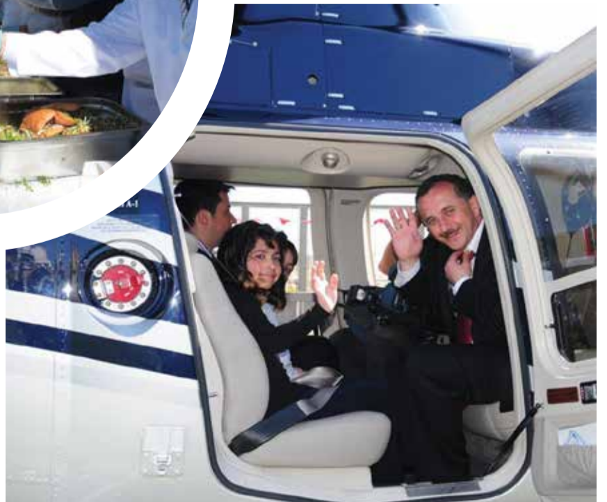
Bağcılar Belediye Başkanı Lokman Çağırıcı