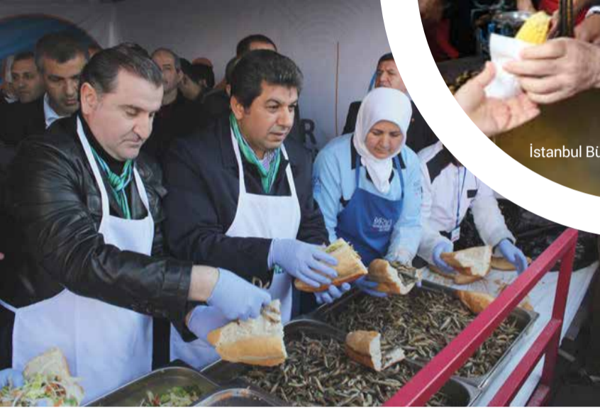
Esenler Belediye Başkanı Tevfik Göksu