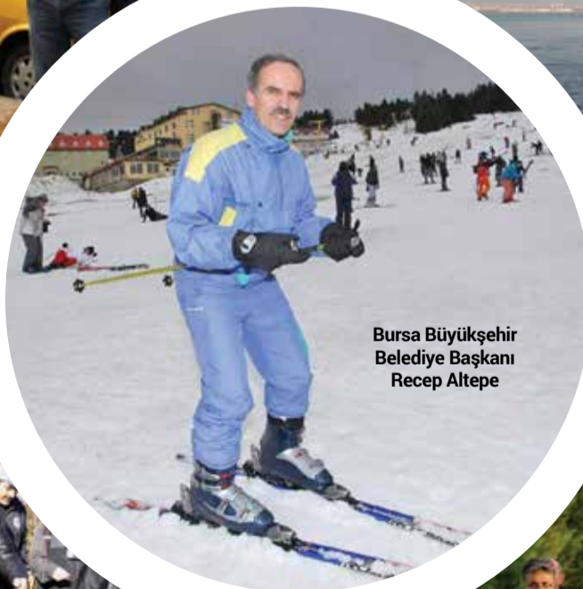
Bursa Büyükşehir Belediye Başkanı Recep Altepe