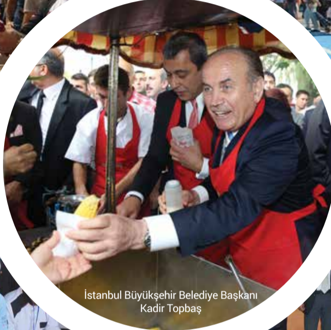
İstanbul Büyükşehir Belediye Başkanı Kadir Topbaş