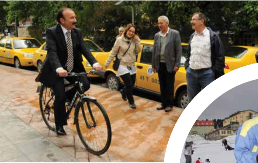
İzmit Belediye Başkanı Nevzat Doğan