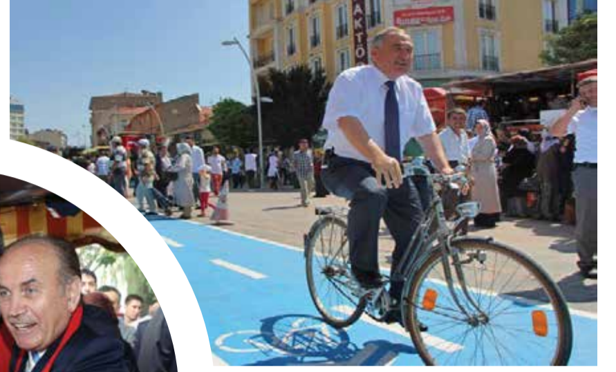
Bolu Belediye Başkanı Alaaddin Yılmaz