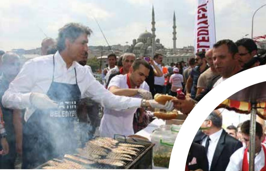
Fatih Belediye Başkanı Mustafa Demir

Yoğun çalışma tempolarına rağmen halkın içinden çıkmayan ve vatandaşla sıcak iletişim kuran Belediye Başkanlarımızın hayata dair fotoğraflarını yayınlıyor, devamını belediye- rimizden bekliyoruz.