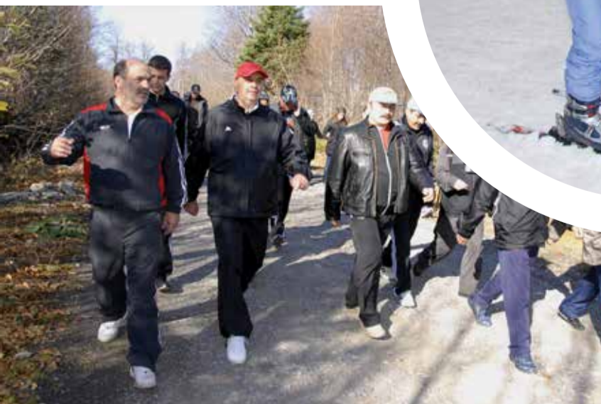
Sakarya Büyükşehir Belediye Başkanı Zeki Toçoğlu