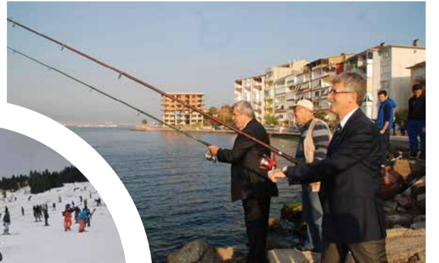
Gölcük Belediye Başkanı Mehmet Ellibeş