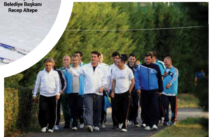
Osmangazi Belediye Başkanı Mustafa Dündar