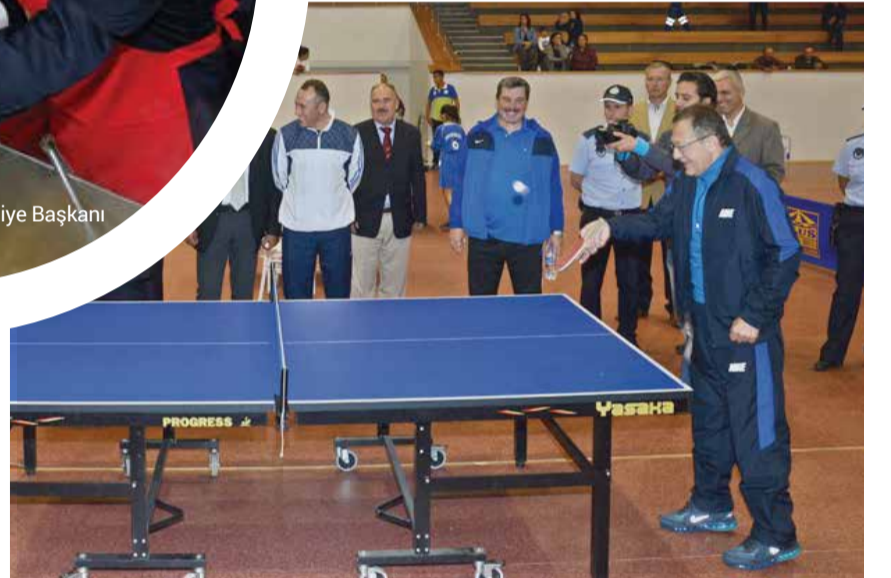
Balıkesir Büyükşehir Belediye Başkanı Ahmet Edip Uğur