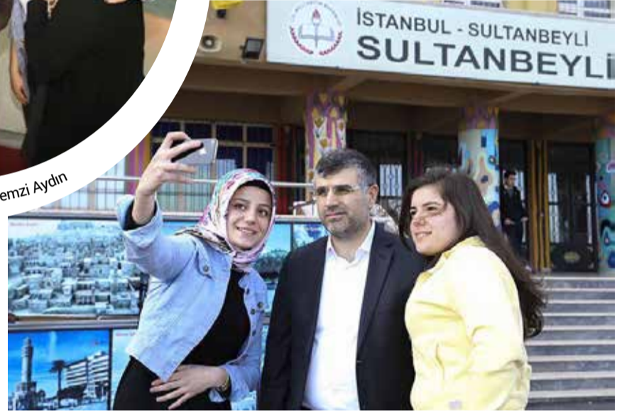
Sultanbeyli Belediye Başkanı Hüseyin Keskin