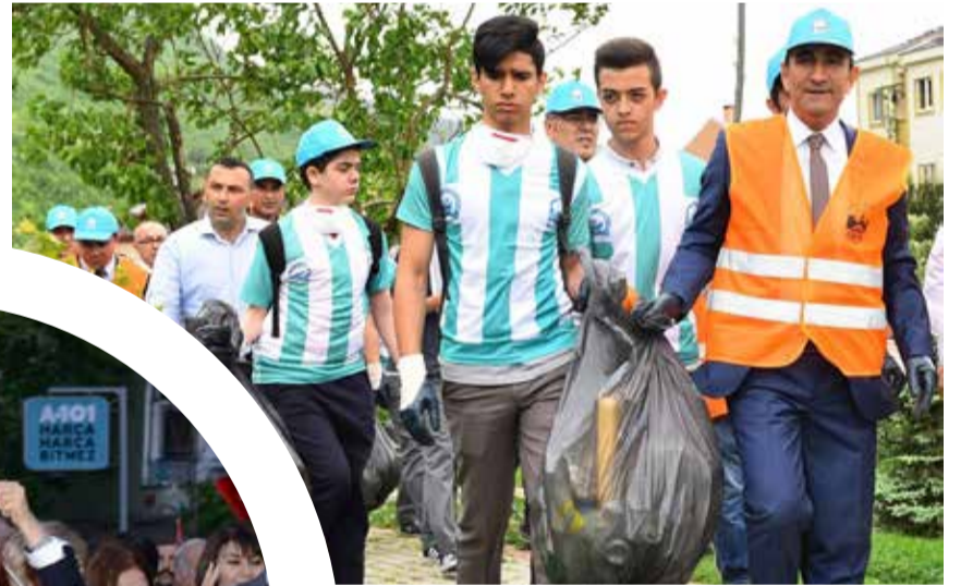
Yıldırım Belediye Başkanı İsmail Hakkı Edebalı