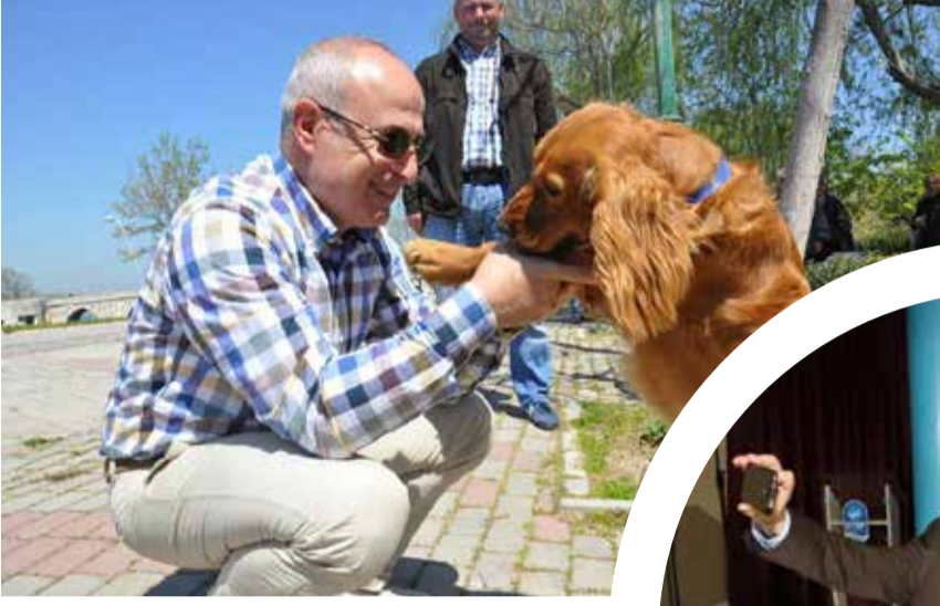
Büyükçekmece Belediye Başkanı Dr. Hasan Akgün

Yoğun çalışma tempolarına rağmen halkın içinden çıkmayan ve vatandaşla sıcak iletişim kuran belediye başkanlarının renkli yüzlerini sizlerle paylaşıyoruz.