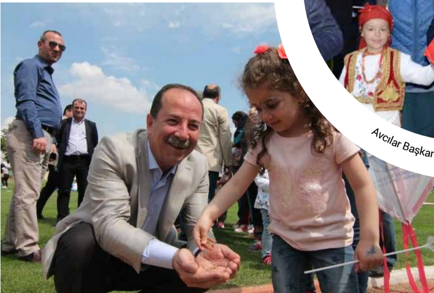
Edirne Belediye Başkanı Recep Gürkan