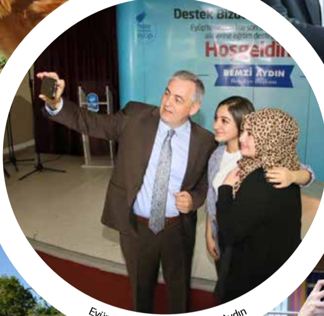
Eyüp Belediye Başkanı Remzi Aydın