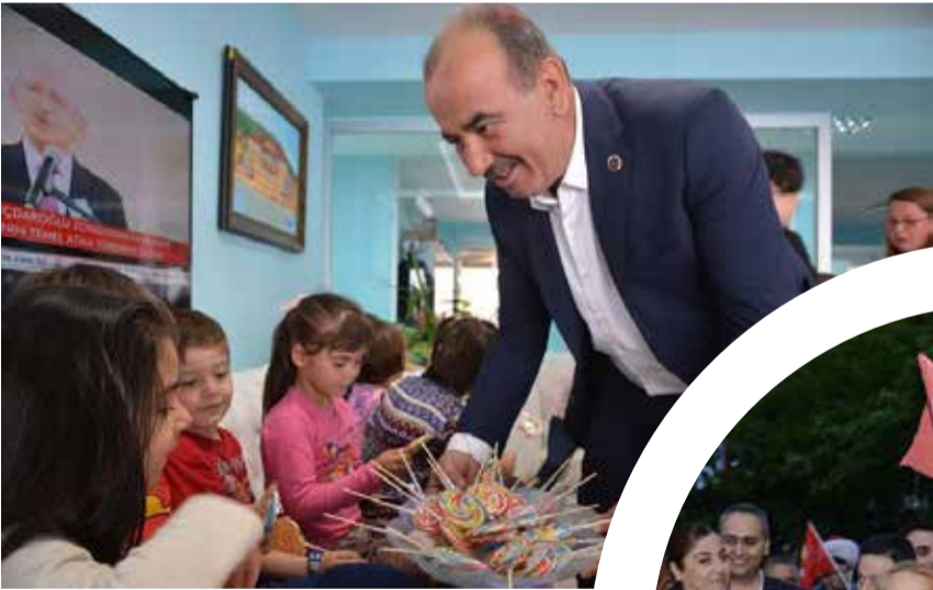
Mudanya Belediye Başkanı Hayri Türkyılmaz