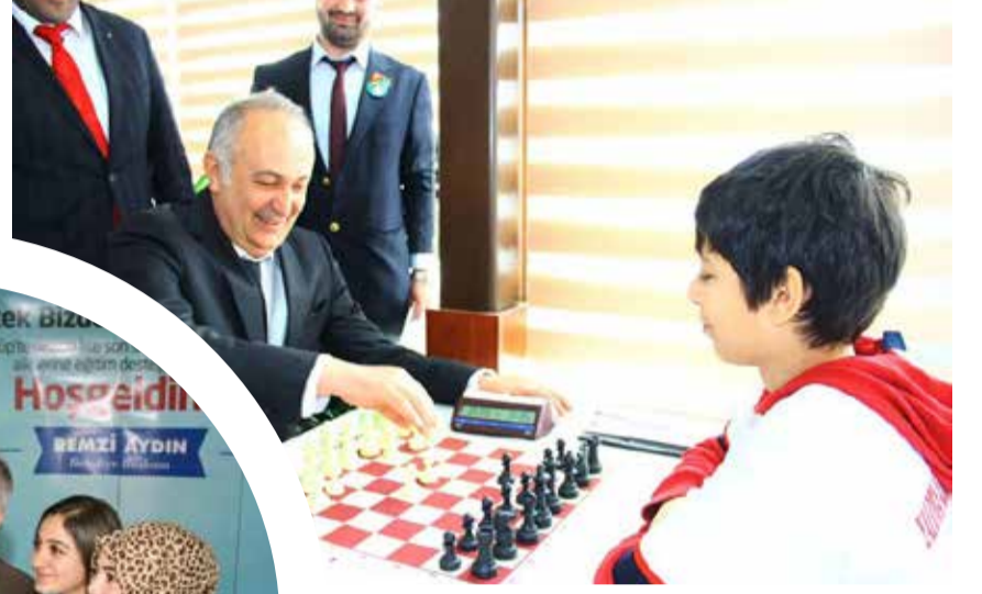
Çiftlikköy Belediye Başkanı Ali Murat Silpağar