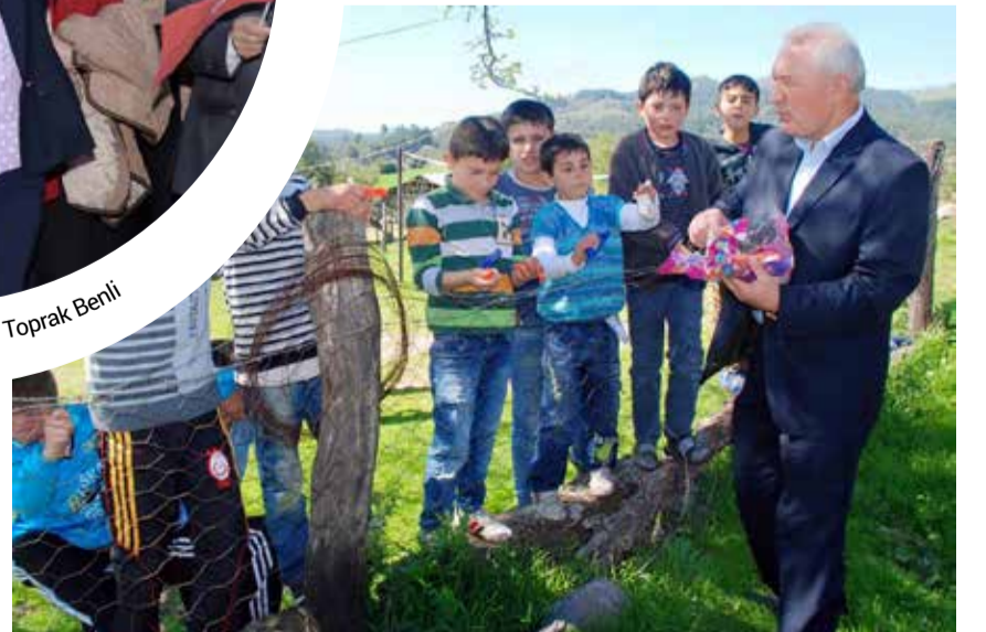
Lapseki Belediye Başkanı Eyüp Yılmaz