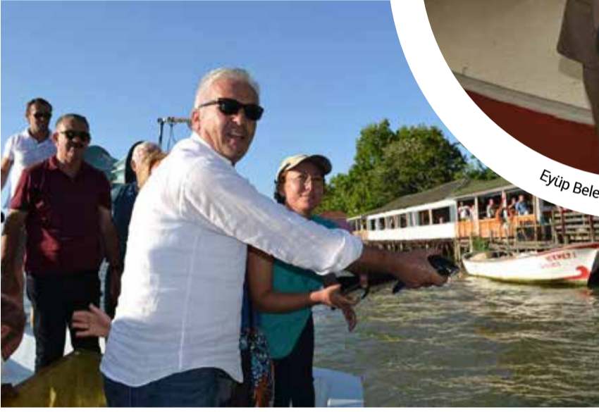
Karasu Belediye Başkanı Mehmet İspiroğlu