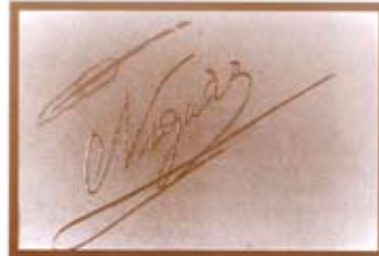
Şair Nigâr Hanım'ın İmzası

Tifüs hastalığına yenik düşerek Nişantaşı'ndaki konakta tek başına vefat eden Nigâr Hanım, Boğaz sularından Rumelihisarı'na getirilerek Kayalar Mezarlığı Şehitliği'nde anne ve babasının yanında ebedi yolculuğa katılmıştır. Batının rasyonel tavrı kadar doğunun hikmet kavramına aşına bu saygıdeğer kadını, zorlu bir dönemin tüm ağırlığını ve sorumluluğunu, gerek özel hayatı, gerekse entelektüel yaşamı ile taşıma gücü gösterdiği için huzurunuzda teşekkür ve dua ile anıyorum. Soyadı Kanunu sonrası çocuklarının Nigâr soyadı alma tercihleri ile evlatlarının gözünde saygın bir anne statüsü kazandığı aşikâr olan Nigâr Hanım, entelektüel seviyesi ve sanatsal duyarlılığı ile Cumhuriyet nesli kadınının önünde, aydınlatıcı bir meşale misali durmaktadır.