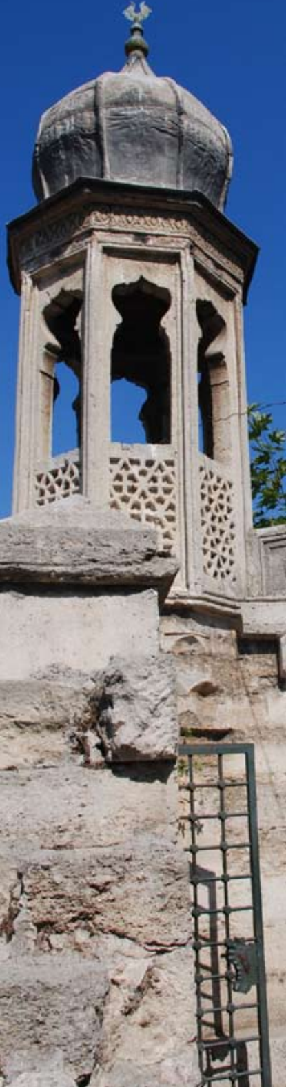
Sokullu Mehmet Paşa Camii'nin dünyada sadece bir benzeri bulunan minaresi

festivale, Bulgaristan, Sırbistan, Slovakya, Macaristan, Polonya, Meksika, Venezuela, Rusya, Yunanistan, Bosna Hersek, Mısır, Beyaz Rusya, Hindistan, K.K.T.C, Nijerya, Gürcistan, Güney Kore, Sierra Leone, Endonezya, Portekiz, Ukrayna ve İtalya'nın da aralarında bulunduğu yaklaşık 24 ülkenin dans grupları katıldı.