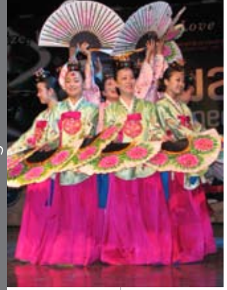
Kervansaray (Kurşunlu Han)