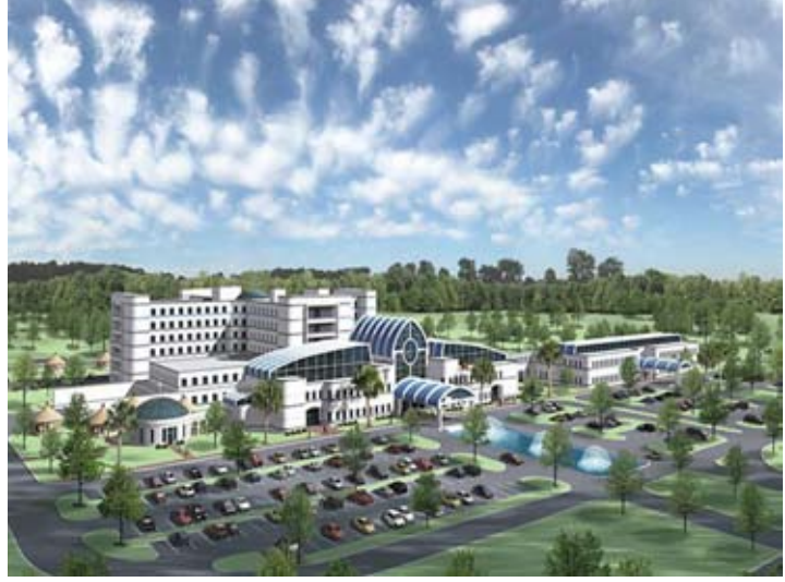
Medikal Vadi içerisinde dünyanın ünlü hastanelerinin yanısıra termal tesisler de olacak.