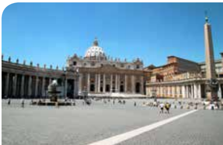
Aziz Petrus Meydanı

Kent meydanları ihtiyaçtır. Mesela İstanbul kültüründe Beyoğlu'na çıkmak vardır. Burada insanlar bir cadde üzerinde sosyal ve kültürel ihtiyaçlarını karşılıyor. İnsanlar burada bir sinemaya gidiyor ya da arkadaşları ile buluşuyor. Bugün bilgisayarla ve plazma televizyonlar ile bir sinemayı evinize taşıyabilirsiniz. Ama ulus devletlerde temsil biçimi ve örgütlenmelerde meydanlar her zaman değerini koruyacaklardır. Çünkü örgütlü toplumlarda insanlar karşı çıkışlarını burada yapacak. Toplumsal çıkışlar tarih boyunca olmuş ve olacak. İstanbul'da meydanlar insanların ortak duygularını bir arada yaşadığı alanlardır. Kültürel perspektiften böyle gözüktür. Doğu Roma ya da Bizans İmparatorluğu'nda Ayasofya ve Hipodromu görüyoruz. Burada insanlar bu mekânı sadece devlet ve halk ilişkiden çok kültürel ve eğlenmek için de tercih ediyor. Mesela Osmanlı döneminde bu neydi diye sorduğumuzda ise Eyüp Sultan ortaya çıkıyor. İktidarın meşrutiyet alanı, padişahların kılıç kuşandığı törenleri için gittiği meşrutiyetin alanlarıdır. Ayrıca Osmanlı medeniyetinden sonra Cumhuriyet medeniyet projesiyle Taksim Meydanı'nı açma fikri çıkıyor ortaya.