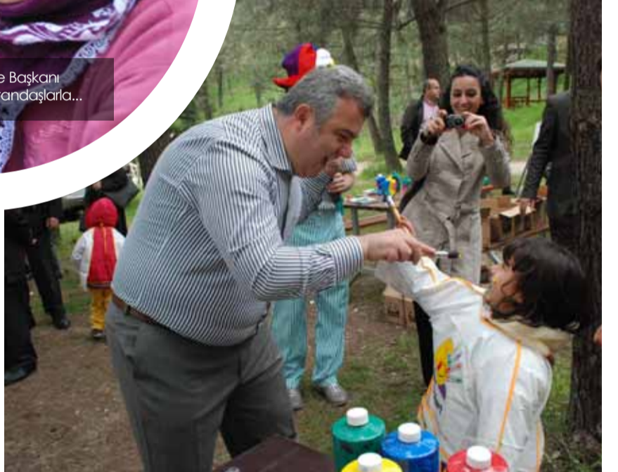
Derince Belediye Başkanı Aziz Alemdar'ı çocuklar rengarenk boyadı