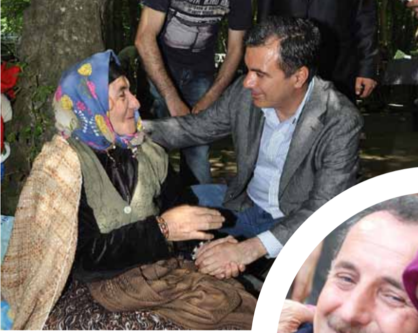
Eyüp Belediye Başkanı İsmail Kavuncu, yaşlı bir kadınla sohbet ederken...

Yoğun çalışma tempolarına rağmen halkın içinden çıkmayan ve vatandaşla sıcak iletişim kuran belediye başkanlarımızın hayata dair fotoğraflarını yayınlıyor, devamını belediyelerimizden bekliyoruz. fatih.sanlav@marmara.gov.tr