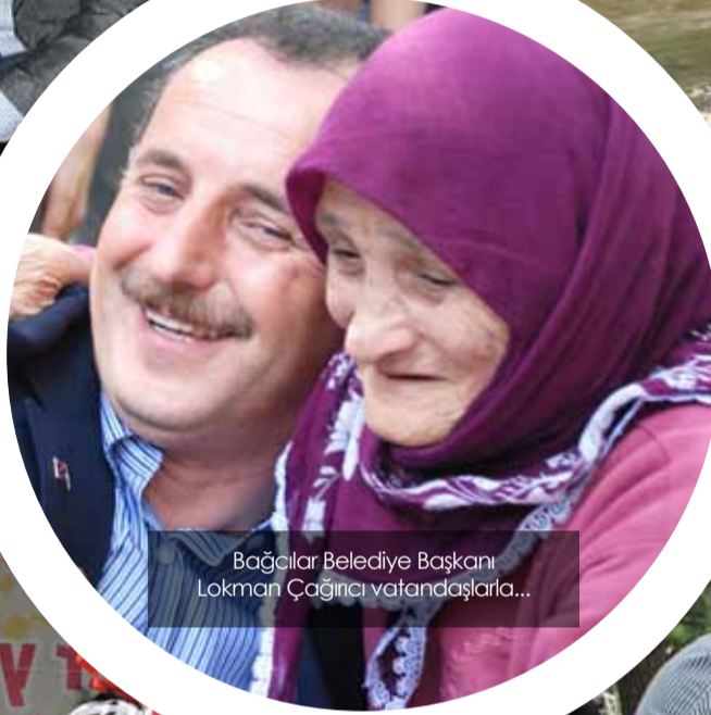
Bağcılar Belediye Başkanı Lokman Çağırıcı vatandaşlarla...